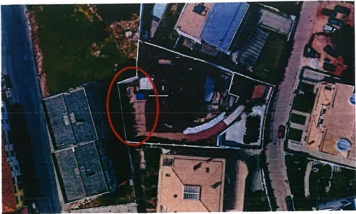
Planta de localização - Imagem aérea Google Earth

A parcela de terreno em análise localiza-se entre a Rua Ariovisto José Valério e a Rua Nossa Senhora do Carmo, na cidade de Setúbal.