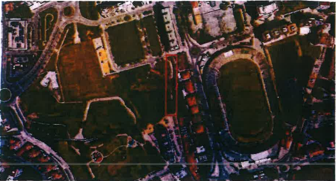
Planta de localização - Imagem aérea Google Earth

A parcela de terreno em análise localiza-se no leito da Estrada da Algoeíra, na União das Freguesias de Setúbal, em Setúbal.