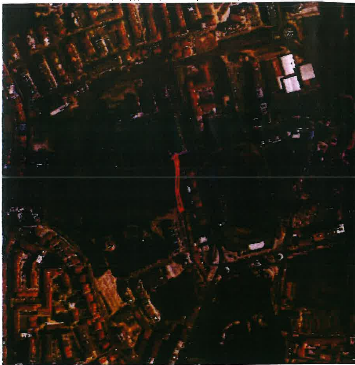
Catografia 1:10 000 da Câmara Municipal de Setúbal (2016) | ETRS89-PT-TM06 | Projeção Transversa de Mercator | Elipsóide UTM80

A identificação da localização é da inteira responsabilidade do requerente.