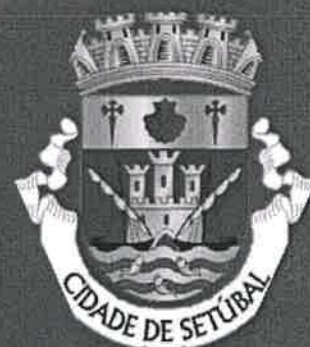
Tabela de Taxas e Outras Receitas