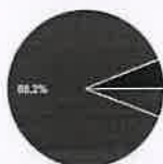
Participou no Festival na qualidade de 17 respostas

● Direção ● Professor ● Aluno ● Familiar ● Outro