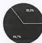
Como avalia a sua experiência durante o processo de preparação do projeto em que participou (planeamento, sessões, estágios, ensaios)? 17 respostas

● Direção ● Professor ● Aluno ● Familiar ● Outro