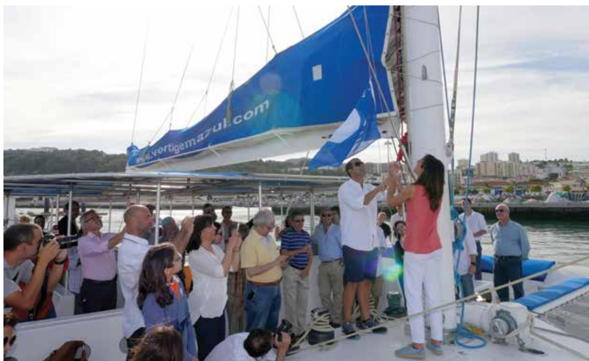
Um parque de merendas sem lixo e uma embarcação com Bandeira Azul. O Dia das Baías foi feito de atividades diversas, incluindo flyboard e música