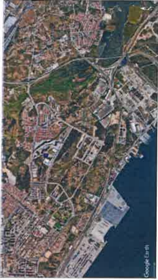
Localização da área de intervenção