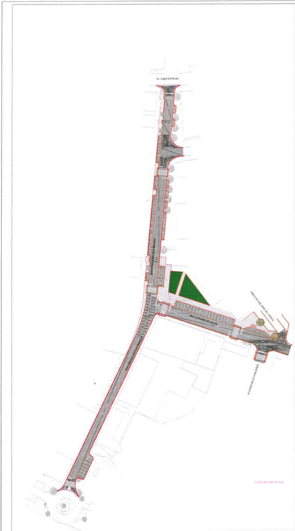
PLANTA DE IMPLANTAÇÃO ESCALA 1/500