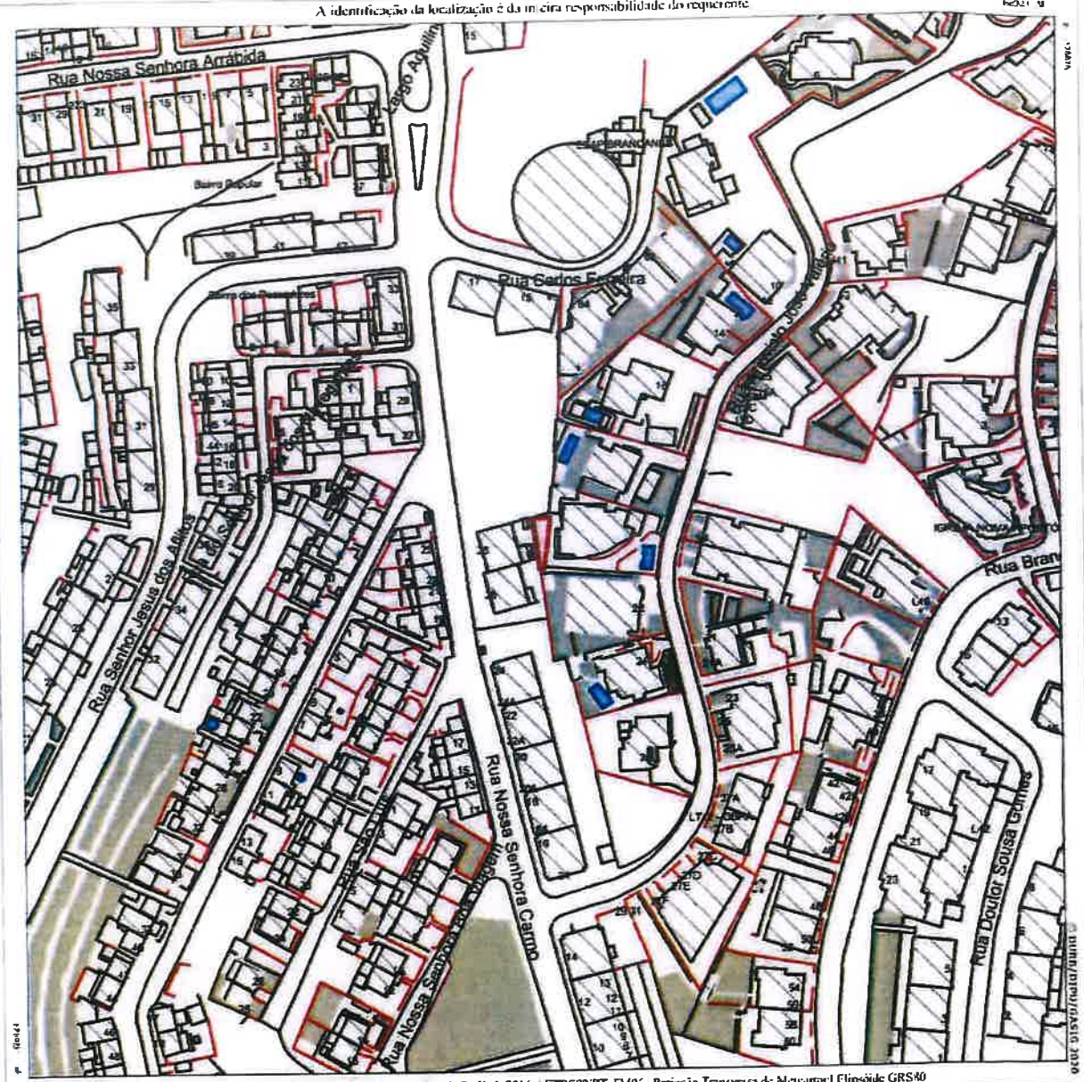
Cartografia 1:10 000 da Câmara Municipal de Setúbal (2016) | ETRS89:PT-TM06 | Projeção Transversa de Mercator | Elipsóide GRS80

A identificação da localização é da inteira responsabilidade do requerente.