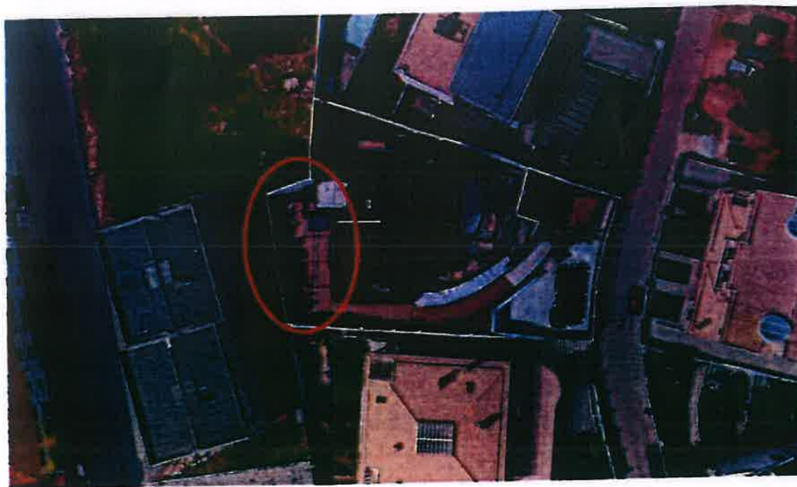
Planta de localização - Imagem aérea

A parcela de terreno em análise localiza-se entre a Rua Ariovisto José Valério e a Rua Nossa Senhora do Carmo, na cidade de Setúbal.