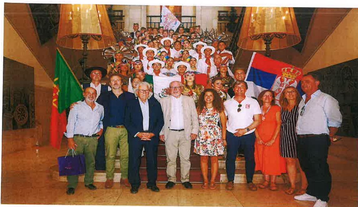
Receção aos grupos no salão nobre da Camara Municipal de Setúbal