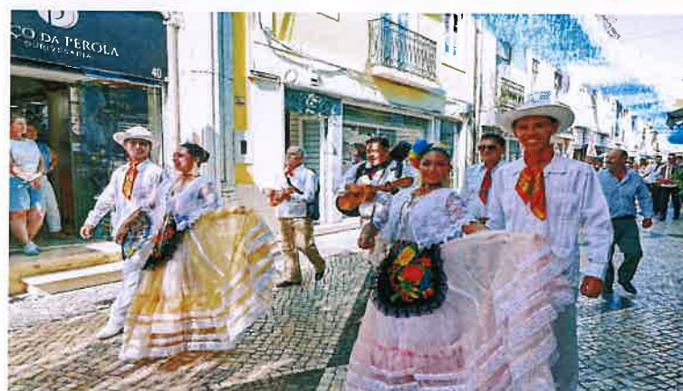
Desfile pelas ruas da baixa