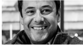
Miguel Dias Agência da Curta-Metragem