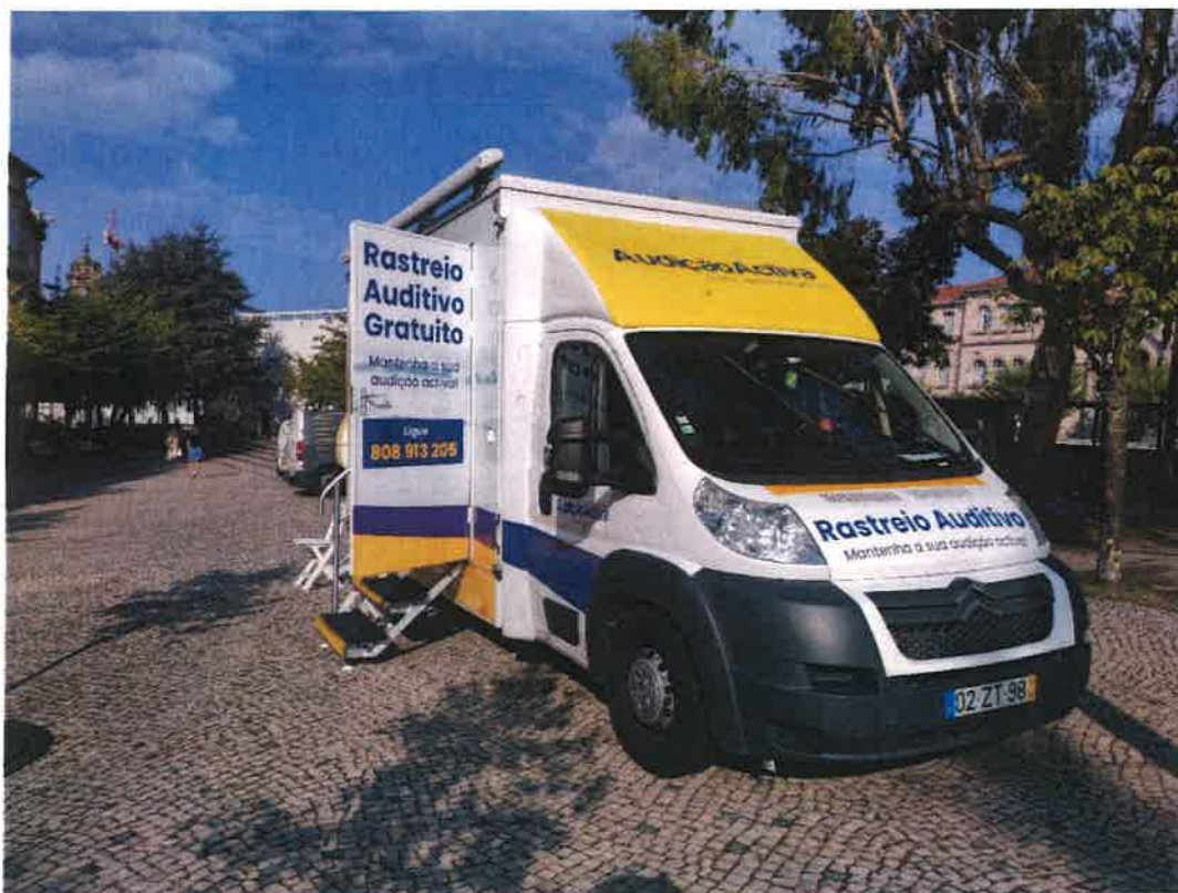
Imagem Unidade Móvel de Saúde