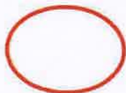
Área assinalada na Carta Educativa do Município de Setúbal, para a ampliação da Escola Básica de Vila Nogueira de Azeitão