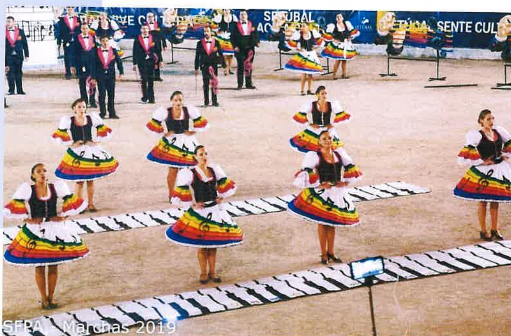
SFPA - Marchas 2019

Um trabalho de mais de uma centena de sócios, marchantes e músicos da coletividade.