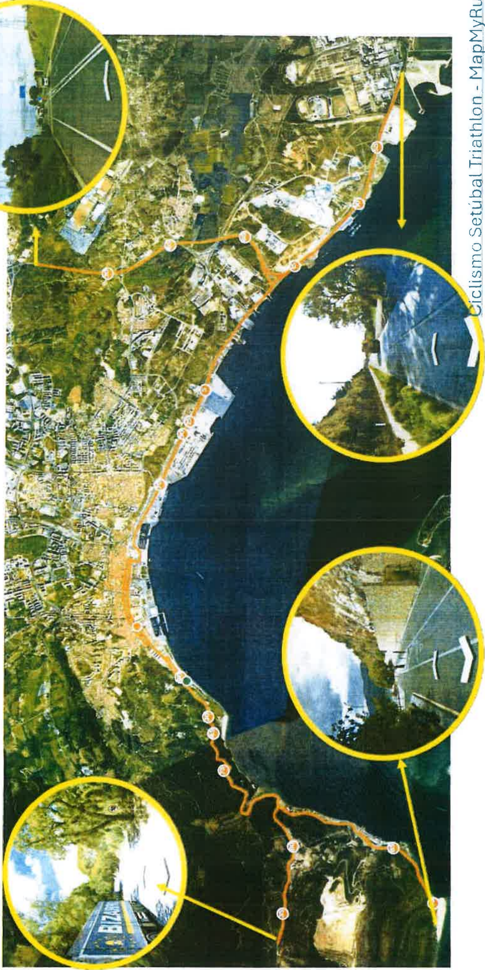
Ciclismo Setúbal Triathlon - MapMyRur