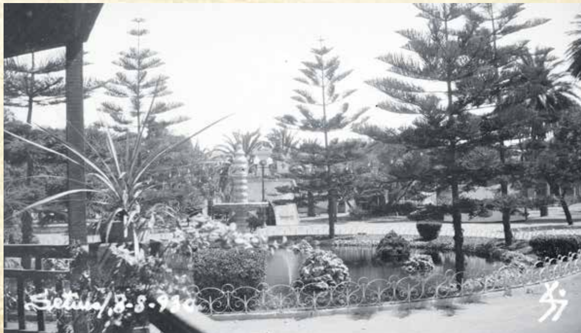
LAZER. O antigo Passeio do Lago, atual Largo José Afonso, foi criado há perto de 150 anos. Postal de 1930, de autor não identificado, do Arquivo Fotográfico Américo Ribeiro

“História e Cronologia de Setúbal 1248-1926”, Albérico Afonso Costa, Setúbal 2011 “Setúbal no meado do século XIX (através das minhas recordações)”, Arronches Junqueiro, Setúbal, 1936