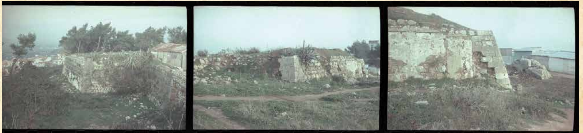
FORTE. Sítio do Castelo ou Forte Velho no Viso. Imagens de 1970 (data de registo)

“Cirurgia e Medicina Positiva”, Manoel Joze da Rocha, Lisboa, 1853 Direção-Geral do Património Cultural “Histórias, Coisas e Gentes de Setúbal”, Rui Canas Gaspar, Setúbal, 2015