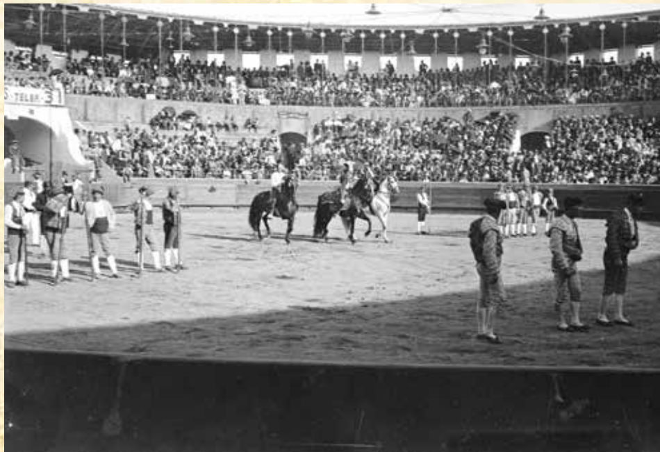
FESTA. Aspeto de tourada – cavaleiros, forcados e assistência em interior de Praça de Touros. Imagem de 1930 (data de registo)

“Histórias, Coisas e Gentes de Setúbal”, Rui Canas Gaspar, Setúbal, 2015 “Setúbal de há 100 anos”, Rogério Claro, 1990