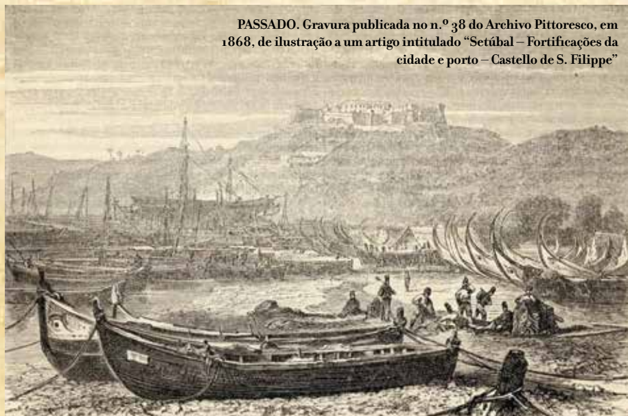
PASSADO. Gravura publicada no n.º 38 do Archivo Pittoresco, em 1868, de ilustração a um artigo intitulado "Setúbal – Fortificações da cidade e porto – Castello de S. Filipe"