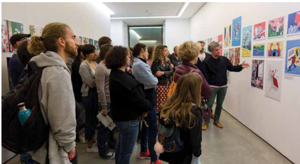
Ilustração faz a festa

Os desenhos regressaram a Setúbal na quarta edição da Festa da Ilustração. O lema mantém-se com a pergunta que já é uma marca do evento que mais expressão dá às ilustrações portuguesas “É preciso fazer um desenho?”. O certame cresce a cada ano e afirma-se como espaço de liberdade e de expressão artística