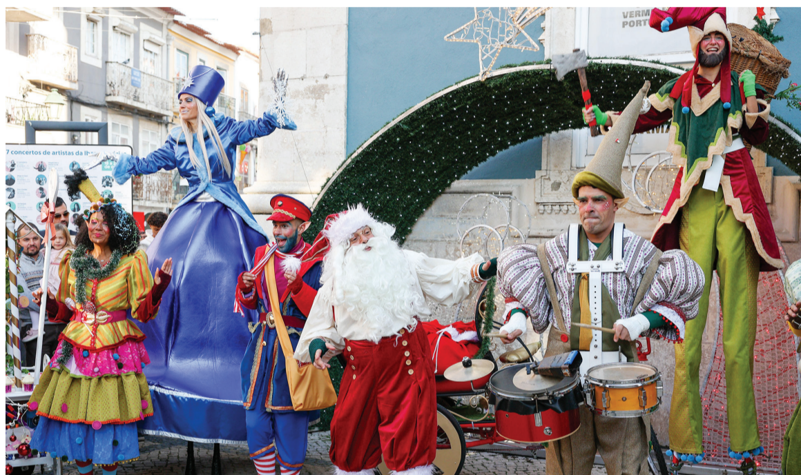
A chegada do Pai Natal é um dos momentos altos do programa, que decorre até 5 de janeiro, com diversas iniciativas

A chegada do Pai Natal no dia 23, às 15h00, é um dos momentos altos das comemorações natalícias em Setúbal,