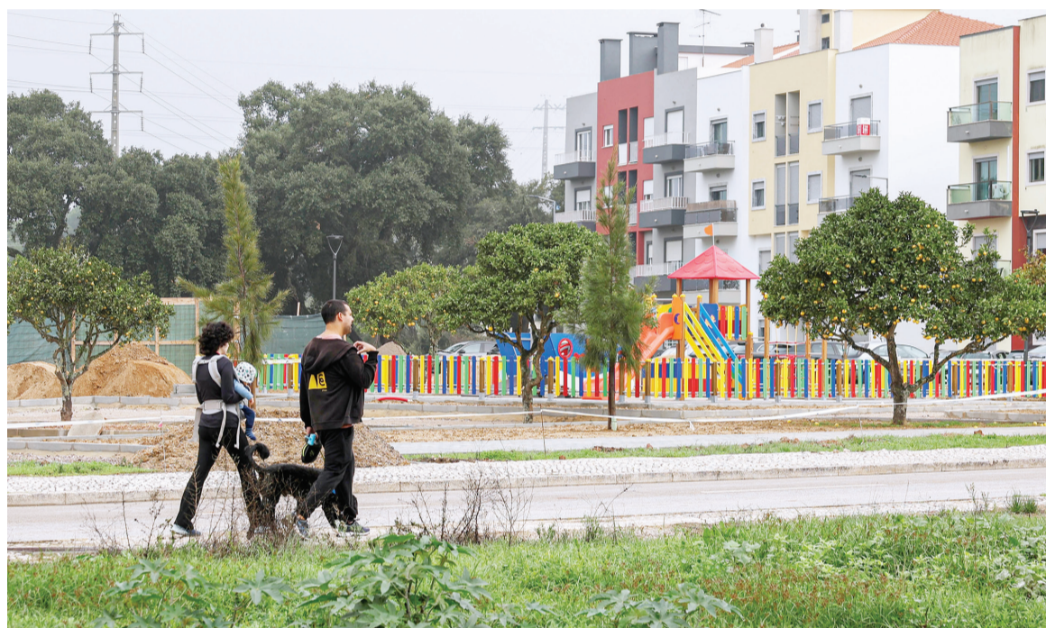
A Quinta da Amizade está a ser alvo de um conjunto de intervenções de qualificação do espaço público

incluíram pequenas limpezas, reparações e a criação de áreas decorativas com vegetação.