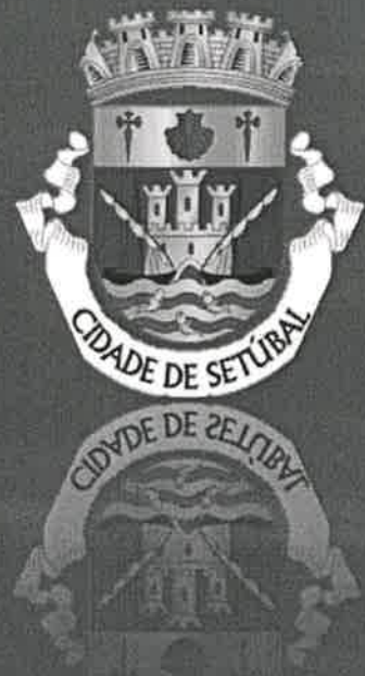
Tabela de Taxas e Outras Receitas