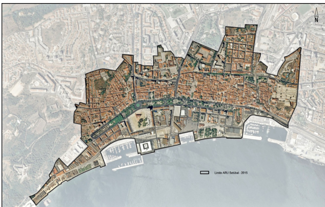
Figura 2. — Delimitação da Área de Reabilitação Urbana de Setúbal — ARU Setúbal 2015

No desenvolvimento das tarefas associadas às operações de reabilitação urbana, aprovou-se, em sessão de Assembleia Municipal de 25 e 28 de setembro de 2015, a primeira alteração da ARU Setúbal ampliando o território abrangido, cujo Aviso foi publicado no Diário da República , de 18 de novembro, sob o n.º 13473/2015. Esta ampliação visou essencialmente incluir todo o centro histórico que ainda hoje é delimitado pelo conjunto de Murallas (seiscentista e medieval), Torres, Portas, Cortinas e Baluartes — monumento classificado de interesse público, introduzir o território a Sul da zona ribeirinha, reforçando a identidade e ligações ao rio e ao mar que detêm os bairros envolvidos e acertos pontuais relacionados com os limites de propriedade, evidenciados na georreferenciação das matrizes dos prédios urbanos.