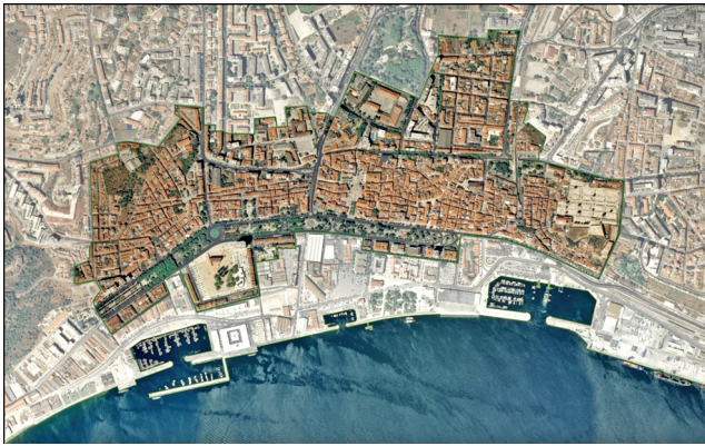
Figura 1. — Delimitação da Área de Reabilitação Urbana de Setúbal — ARU Setúbal 2013

No desenvolvimento das tarefas associadas às operações de reabilitação urbana, aprovou-se, em sessão de Assembleia Municipal de 25 e 28 de setembro de 2015, a primeira alteração da ARU Setúbal ampliando o território abrangido, cujo Aviso foi publicado no Diário da República , de 18 de novembro, sob o n.º 13473/2015. Esta ampliação visou essencialmente incluir todo o centro histórico que ainda hoje é delimitado pelo conjunto de Murallas (seiscentista e medieval), Torres, Portas, Cortinas e Baluartes — monumento classificado de interesse público, introduzir o território a Sul da zona ribeirinha, reforçando a identidade e ligações ao rio e ao mar que detêm os bairros envolvidos e acertos pontuais relacionados com os limites de propriedade, evidenciados na georreferenciação das matrizes dos prédios urbanos.