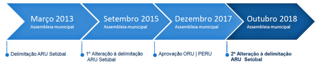
Figura 3. — Esquema Cronológico das Deliberações Aprovadas em Assembleia Municipal sobre a Área de Reabilitação Urbana de Setúbal

Nos termos do disposto no artigo 20.º do RJRU, o município, enquanto entidade gestora, elaborará anualmente um relatório de monitorização da operação de reabilitação, o qual será submetido à apreciação da Assembleia Municipal. Da mesma forma, a cada cinco anos de vigência da ORU, submeter-se-á à apreciação da Assembleia Municipal um relatório de avaliação da execução da mesma, acompanhado, se assim se entender necessário, de uma proposta de alteração do respetivo instrumento de programação, sem prejuízo da possibilidade de alteração, também a qualquer momento, da própria delimitação da ARU.