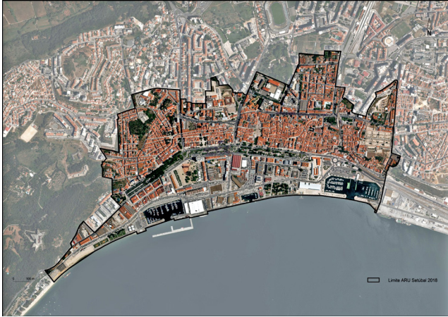
Figura 5. — Alteração proposta à Delimitação da Área de Reabilitação Urbana de Setúbal — ARU Setúbal 2018

Atendendo a que se trata de uma ampliação de vinte e cinco edifícios o que representa, apenas uma margem inferior a 1 % dos mesmos, considera-se que não estão em causa, nem serão alterados qualquer um dos pressupostos aprovados em sede de ORU e PERU a decorrer, mantendo-se inalterada a macro estratégia prevista. Em fase de relatório de monitorização/ avaliação da ORU serão, oportunamente, atualizados os dados e efetuadas as devidas adaptações.