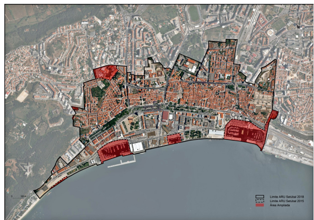
Figura 4. — Alteração à Delimitação da Área de Reabilitação Urbana de Setúbal — Sobreposição ARU Setúbal 2015 e 2018

A extensão da ARU Setúbal, passará dos atuais 1 393 338 m 2 da ARU de Setúbal 2015, para 1 558 695 m 2 estando englobados total de mais de 2916 edifícios e estimando-se cerca de 10 250 unidades.