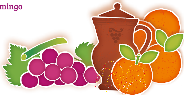
Feira de Sant'Iago 2019 - Programa