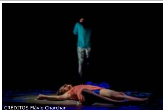
CRÉDITOS Flávio Charchar

Colocar-se no lugar do outro. Misturar as cores, os tons. Confrontar-se. O choque não é de mulheres contra os homens. O choque é contra um pensamento que limita a liberdade humana, mas principalmente, de mulheres. O choque – sem violência – é para que haja o encontro. Em cena, a questão da violência contra a mulher. Para além das diferenças físicas e biológicas, o que distingue homens e mulheres no nosso imaginário? Em um mundo no qual essa violência está naturalizada, o espectáculo