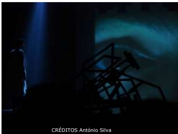
CRÉDITOS António Silva