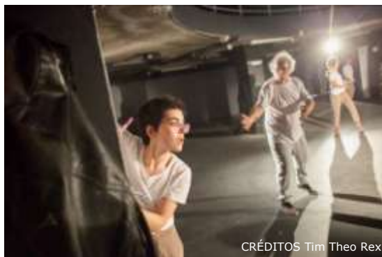
CRÉDITOS Tim Theo Rex

É uma tela de Pollock. É uma tentativa de abrir espaços entre os limites. É sobre corpos que se movimentam atrás de um bater de coração num tempo previamente escolhido. É uma tentativa de viver e encontrar respostas múltiplas a perguntas concretas. É uma tentativa de olhar para a vida de novo, de compreendê-la e de nos compreendermos uns aos outros. É sobre voltar a quando éramos livres e tudo era possível. É sobre o aqui e agora.