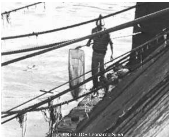
CRÉDITOS Leonardo Silva

31 Sexta-feira | 22h | Praça do Bocage LUGAR DE TÚBAL (ESTREIA) > Teatro Estúdio Fontenova M/12 anos – Duração aprox.: 45 minutos