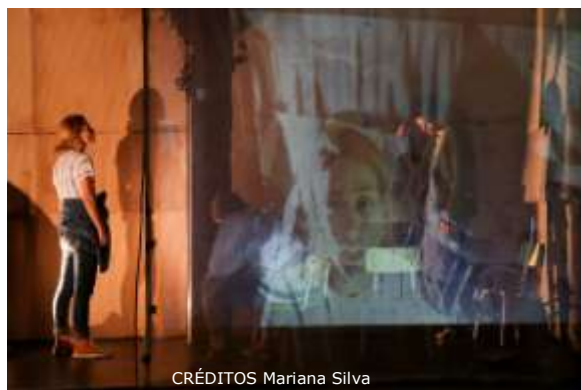
CRÉDITOS Mariana Silva

Seattle tem uma meteorologia própria, aquela gerida pela paisagem interior das personagens. A dinâmica e o ambiente tchekhoviano apontam o frio, o passar dos dias a fio, sempre iguais, e o difícil divorciar dos espaços de recordação, de convivência e de partilha: a mesma que habita e inspira o espírito grunge . Seattle é para nós a metáfora dos sonhos, daqueles que apenas se apresentam como um lugar de memória que, afinal, nunca se habitou.