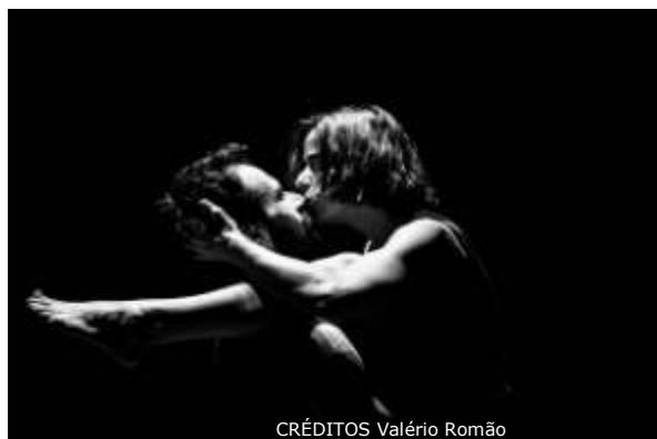
CRÉDITOS Valério Romão

30 Quinta-feira | 22h | Ginásio da Escola Secundária Sebastião da Gama AAC – ASSOCIAÇÃO AMIZEADO NO CASAMENTO > Escola de Mulheres M/14 anos – Duração aprox.: 60 minutos