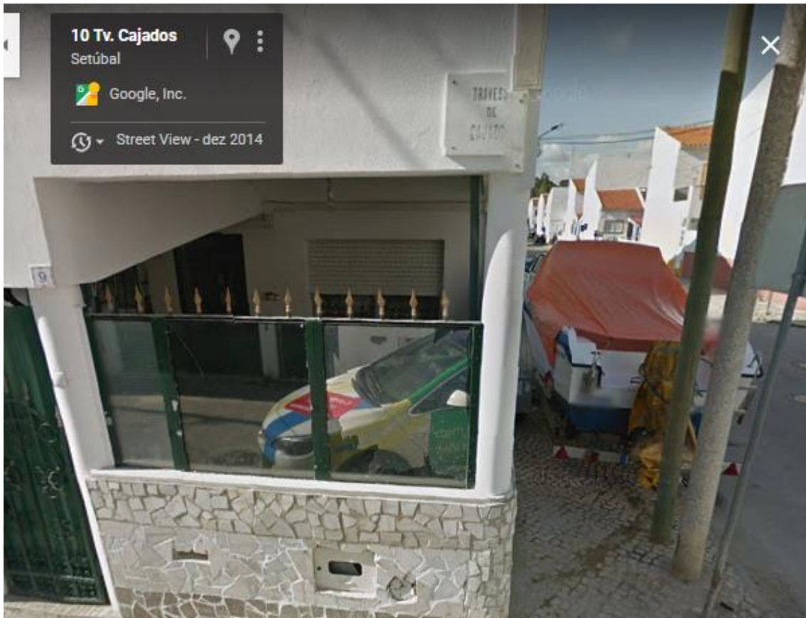
Residência do proprietário dos barcos: dezembro/2014