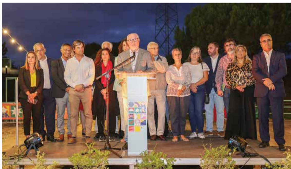
O presidente André Martins deu conta, na Receção à Comunidade Educativa, da estratégia municipal em curso

U ma educação de qualidade, inclusiva e participativa. Estas são premissas da Câmara Municipal de Setúbal no trabalho que desenvolve para assegurar ensino para todos, condições de trabalho condignas e a defesa da escola pública. “A escola pública representa a