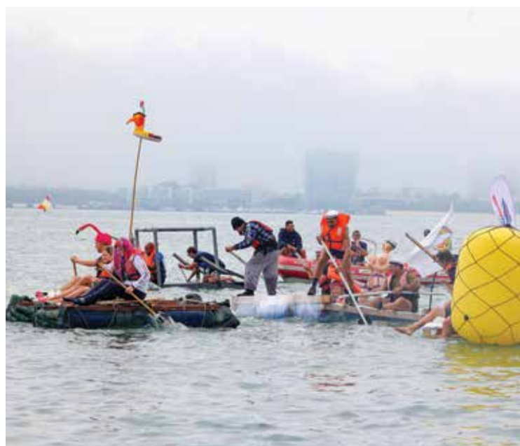
Nem o nevoeiro impediu os participantes de se fazerem à água

meçou logo pelas oito e meia da manhã para os materiais reutilizáveis escolhidos darem lugar a peças utilizadas na construção das embarcações, que navegaram num circuito delimitado em frente do Parque Urbano de Albarquel.