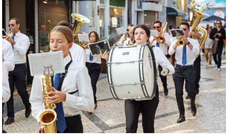
O Festival de Bandas Filarmónicas da Cidade de Setúbal atuou na Baixa