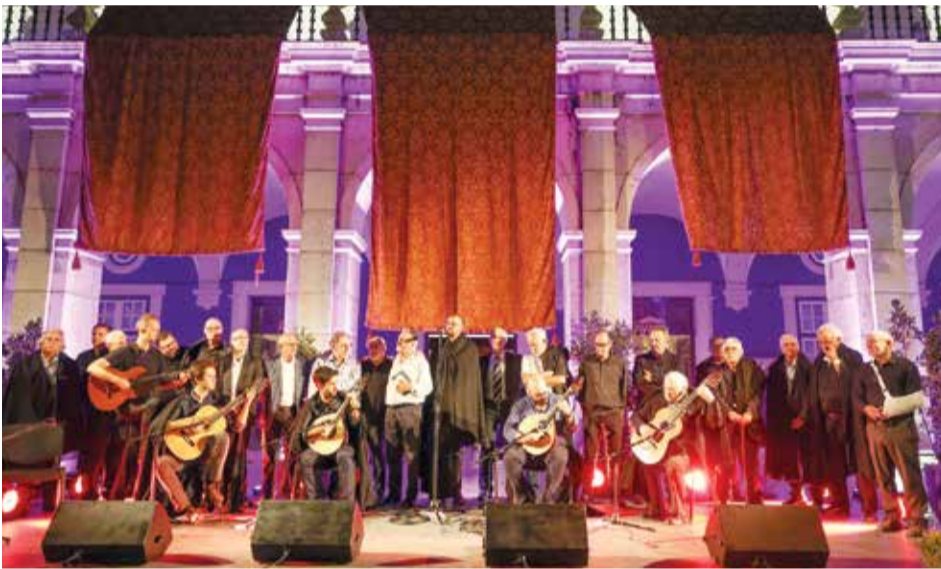
Dezena e meia de fadistas encerraram o Fado em Setúbal 2024