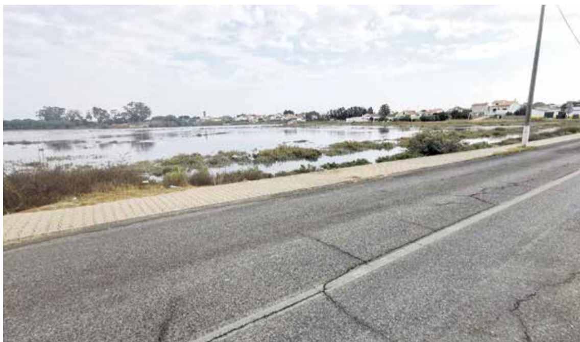
Galgamentos estuarinos têm atingido as freguesias do Sado e de Gâmbia-Pontes-Alto da Guerra

O fenómeno das inundações estuarinas, causado por marés vivas frequentes e de cota elevada, preocupa o município. A necessidade de avançar com um plano de ação, com parcerias, já foi identificada