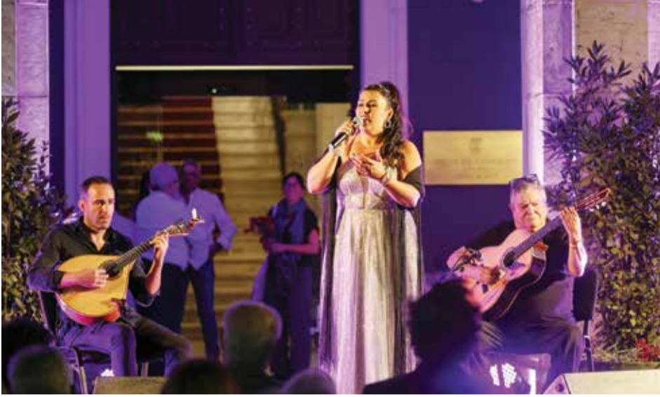
A IX Serenata de Fado de Coimbra em Setúbal foi um dos destaques