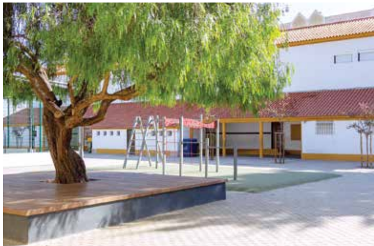
Obras de perto de 250 mil euros foram realizadas em onze escolas