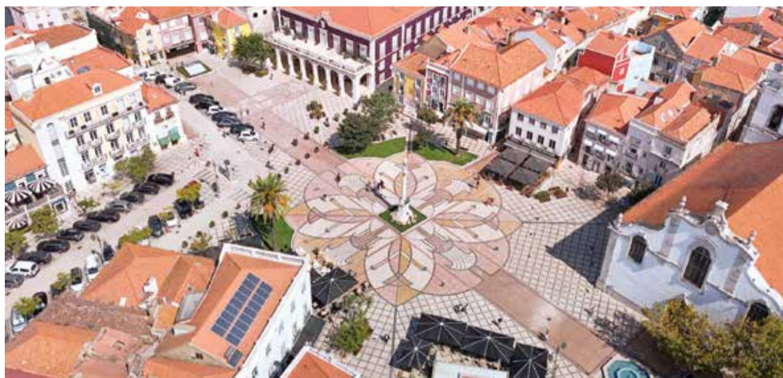
Setúbal é um exemplo na captação dos fundos do Plano de Recuperação e Resiliência para benefício da população

A Câmara Municipal de Setúbal aproveita os fundos do PRR – Plano de Recuperação e Resiliência como poucas entidades. O financiamento ajuda a desenvolver projetos em benefício da população