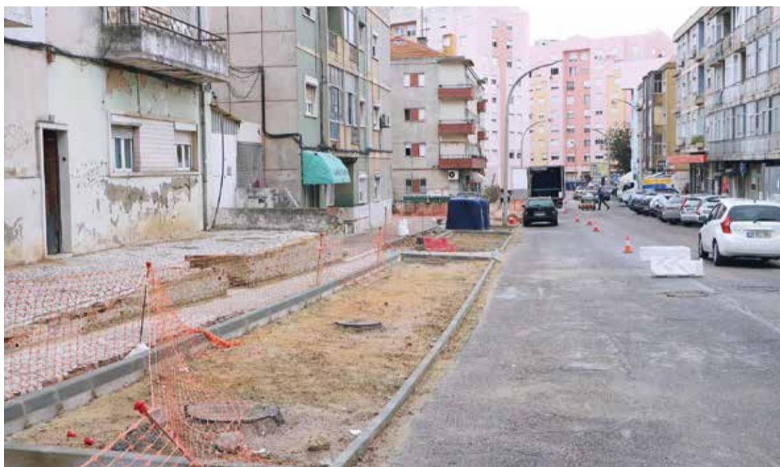
A obra de requalificação urbana deve ficar concluída no primeiro trimestre do próximo ano

A Rua da Camarinha está a ser intervencionada numa obra executada pela Junta de Freguesia de São Sebastião, em parceria com a Câmara Municipal de Setúbal, para aumentar a qualidade urbana, com primazia para o usufruto público. A operação em curso no Bairro da Camarinha, um investimento de cerca de 140 mil euros, reforça a mobilidade, com a renovação de pavimentos e a eliminação de barreiras arquitetónicas, o que permite a criação de áreas de circulação mais acessíveis, com zonas de estadia e ensombramento.