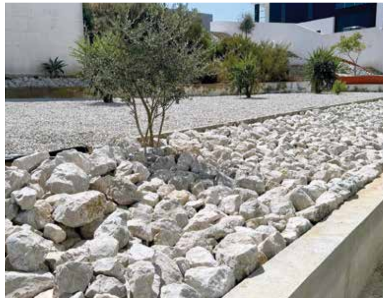
O antigo espaço urbano ganhou zonas decorativas com vegetação

A Junta requalificou ainda os quatro bancos públicos instalados na Rua dos Sobreiros, com a reabilitação da estrutura metálica, lixada e repintada, e a instalação de um novo ripado em madeira, garantindo-se, desta forma, um maior conforto para os utilizadores.