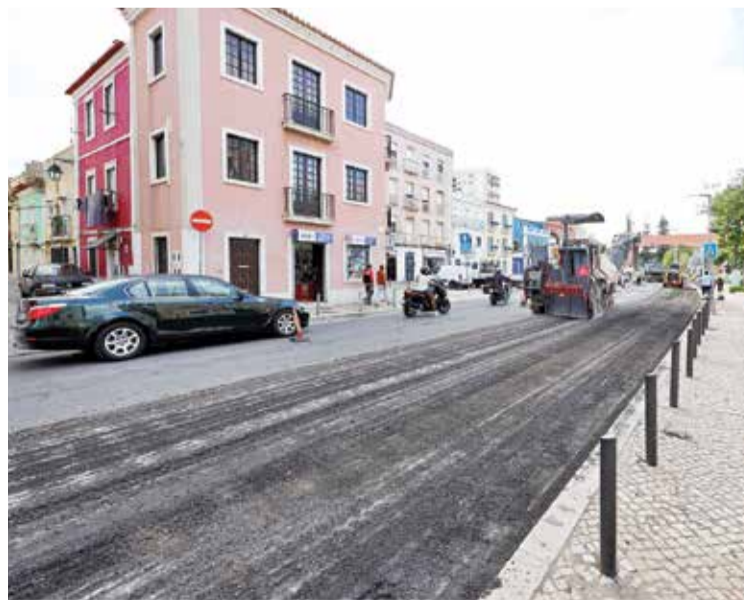
A obra é uma parceria do município com a União das Freguesias de Setúbal

Em simultâneo, é feita a correção geométrica do passeio e da ilha direcional situados no entroncamento da Rua José Pereira Martins com a rotunda Flores da Arrábida, para aumentar a visibilidade e segurança.