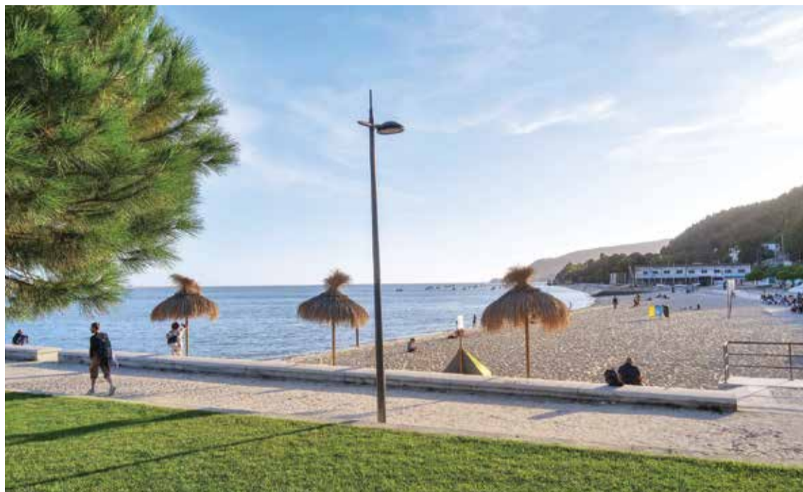
Recuperação de fundos marinhos da Praia da Saúde poderá garantir criação de zona balnear

A viabilidade da recuperação dos fundos marinhos da Praia da Saúde vai ser analisada pela Câmara Municipal de Setúbal. Os estudos a realizar, com financiamento comunitário aprovado, servirão de suporte à classificação como zona balnear