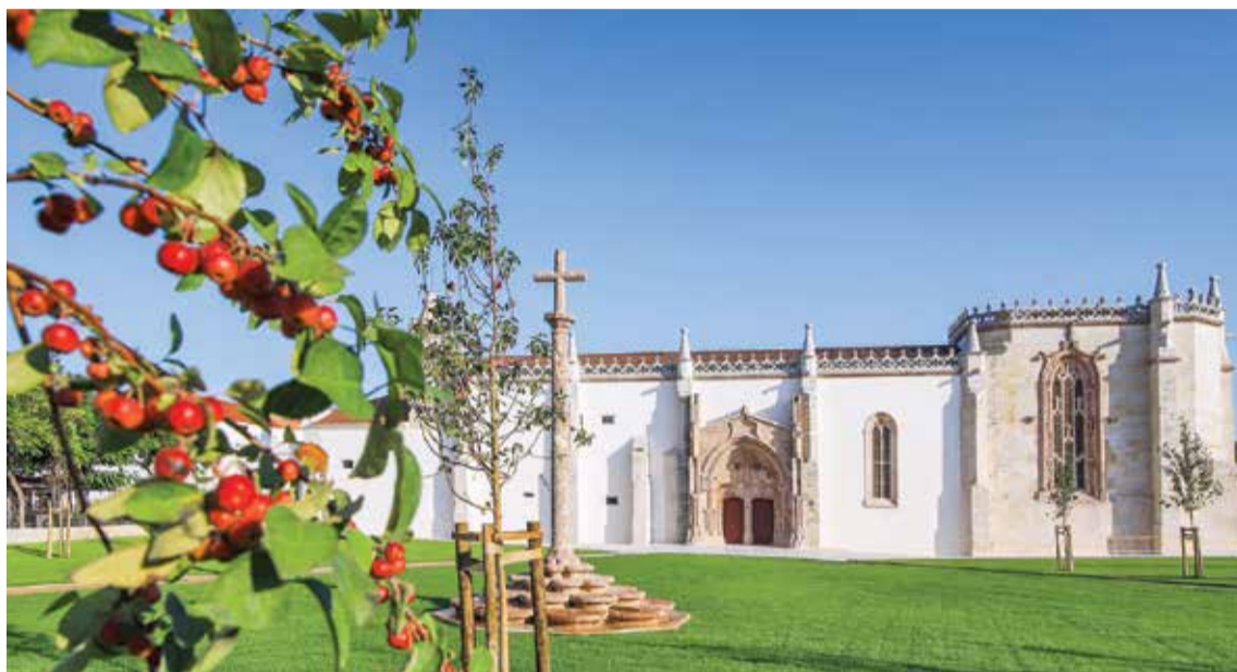
A terceira fase das obras finalizou a recuperação do Convento de Jesus, onde se encontra o Museu de Setúbal

O Museu de Setúbal é devolvido à cidade a 30 de novembro, depois de obras profundas, para mostrar, em condições nunca vistas, arte que se encontrava afastada do público há mais de duas décadas. A joia principal, o Retábulo do Convento de Jesus, está de regresso