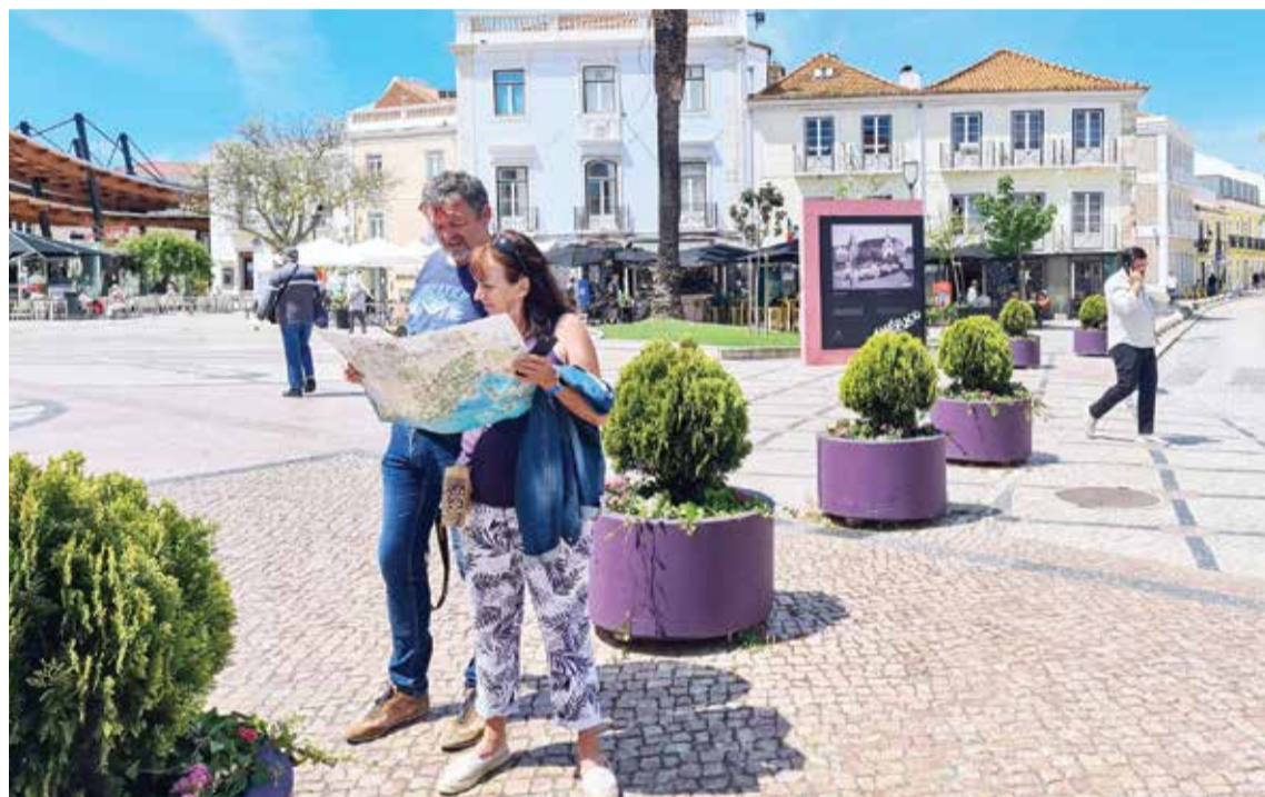
O concelho de Setúbal prossegue o caminho de afirmação enquanto destino turístico de excelência

reforço do turismo em Setúbal. O investimento no setor turístico é aposta ganha e alavanca Setúbal na rota do crescimento e notoriedade que têm vindo a ser alcançados nos últimos anos, como comprovam os dados oficiais do Instituto Nacional de Estatística e do Turismo de Portugal.