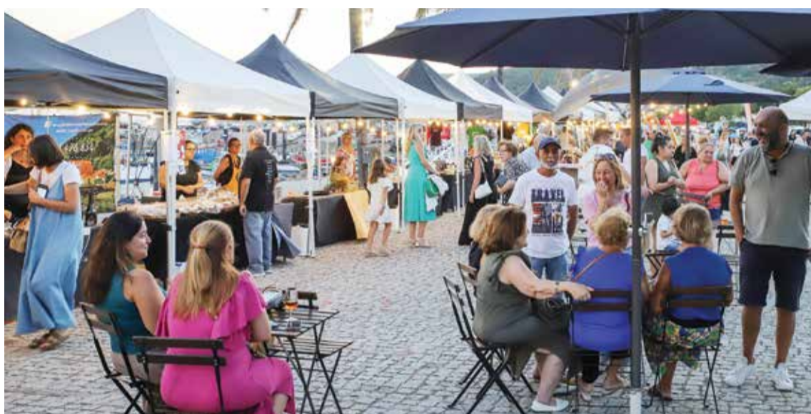
A Mostra de Sabores e Sabores decorreu numa frente ribeirinha dinamizada