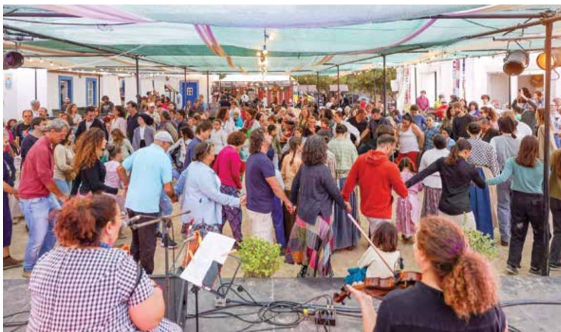
A Festa Salicórnica proporcionou, durante dois dias, diversas atividades, incluindo um programa cultural

M úsica e dança tradicionais, artesanato e gastronomia preencheram o largo do Moinho de Maré da Mourisca, a 5 e 6 de outubro, na segunda edição da Festa Salicórnica – Tradições do Sado, com o envolvimento da comunidade local na celebração da identidade cultural. O evento, organizado pela Junta de Freguesia do Sado em parceria com a Câmara Municipal, proporcionou dois dias de atividade com o objetivo de sensibilizar para a importância de preservar costumes e tradições culturais e salvaguardar o