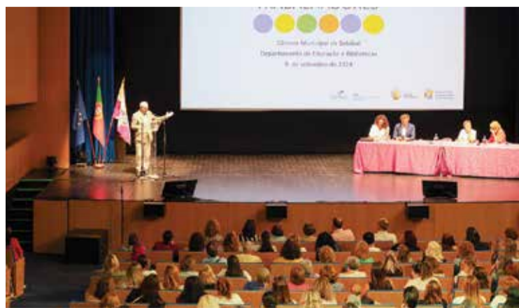
As reuniões decorreram com todos os departamentos

te para o desenvolvimento do concelho, para o bem-estar das populações", afirmou o presidente do município. Estas sessões com os diversos departamentos do Município permitiram transmitir informações de interesse, para que os funcionários possam participar nas decisões da autarquia e conhecer melhor o trabalho reali-