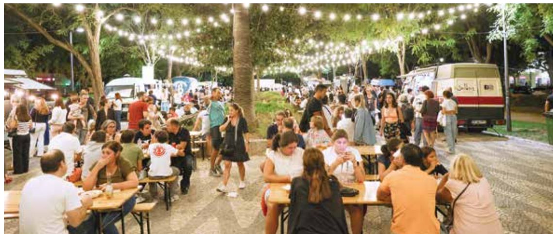
O evento contou com dez food trucks, que apresentaram diferentes sabores do mundo

“Urban Hambúrgueres”, americana, “Ganso’s”, venezuelana, “Hey Foodie”, italiana, “Go Mars”,