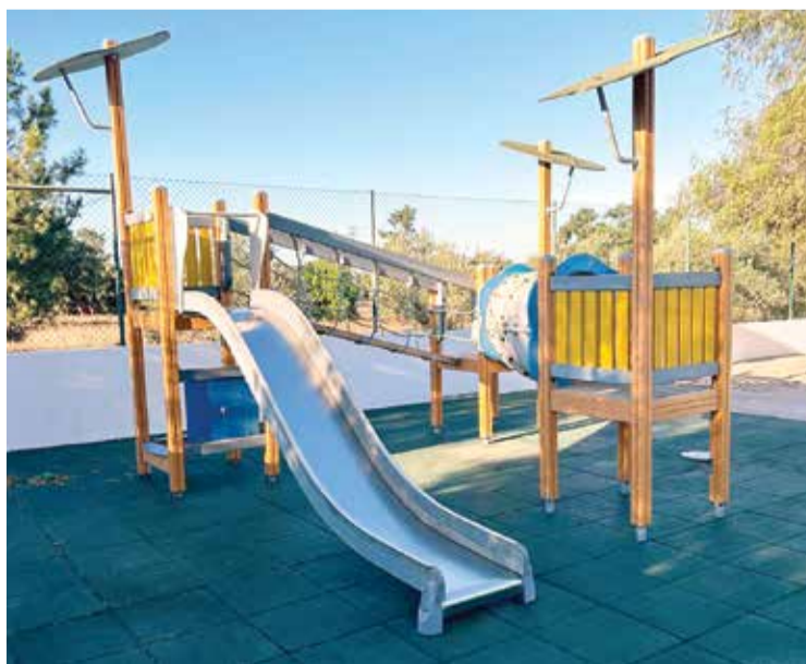
Os equipamentos infantis proporcionam novas brincadeiras

requalificações, os trabalhos foram já concluídos nos parques infantis da Escola Básica de Gâmbia, com a instalação de um novo pavimento, e da Escola Básica Montinho da Cotovia, totalmente renovado, assim como de novos brinquedos, o que sucedeu também no