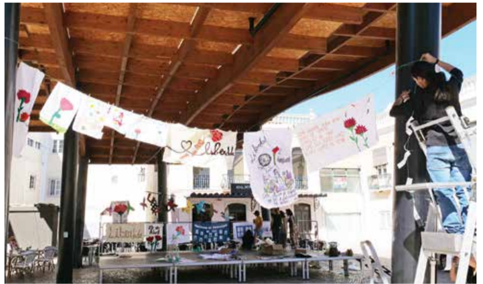
O "Estendal da Liberdade" esteve patente na Praça de Bocage