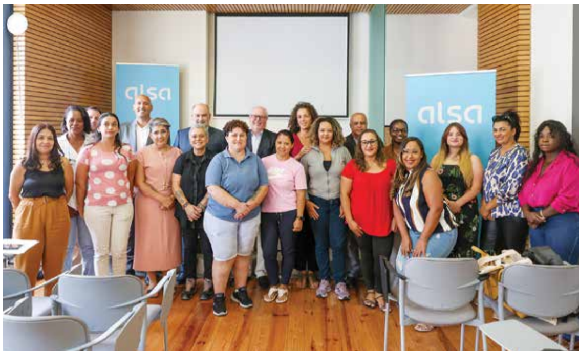
O protocolo que formaliza o processo de formação das motoristas foi assinado em cerimónia na Casa da Baía

As candidatas foram selecionadas num programa especial de formação da empresa que opera a Carris Metropolitana no concelho