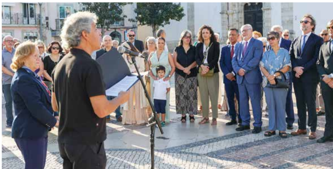
Uma homenagem especial a Bocage incluiu deposição de flores e leitura de poemas

O dia incluiu atividades de lazer, exposições, literatura e teatro, como uma Mostra de Saberes e Sabores junto da Doca dos Pescadores, com perto de duas dezenas de produtores e artesãos locais.