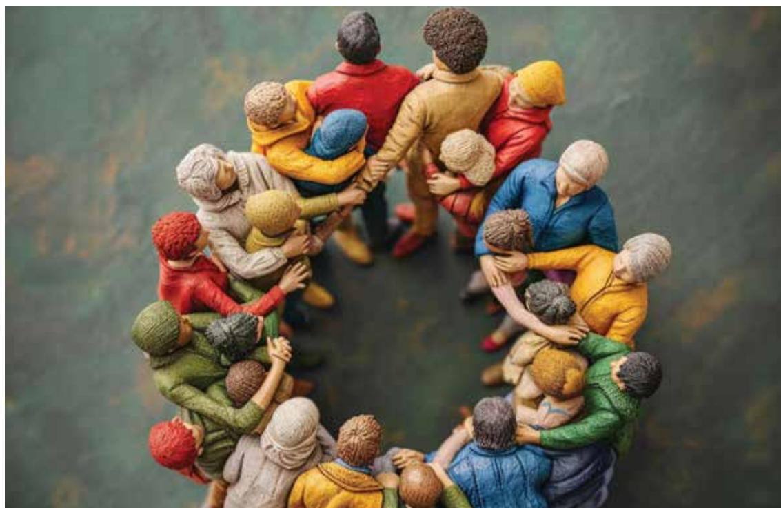
Os polos estão de portas abertas ao voluntariado para apoio das atividades

Na esfera de intervenção social, a Junta dispõe ainda de outras medidas de auxílio, como um serviço de acompanhamento personalizado de ação social e um programa de apoio à aquisição de gás engarrafado, destinado a famílias com menores rendimentos.