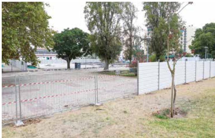
A construção do Centro Escolar Barbosa do Bocage já foi iniciada

“Estamos a trabalhar para garantir a requalificação de quatro escolas de intervenção prioritária”