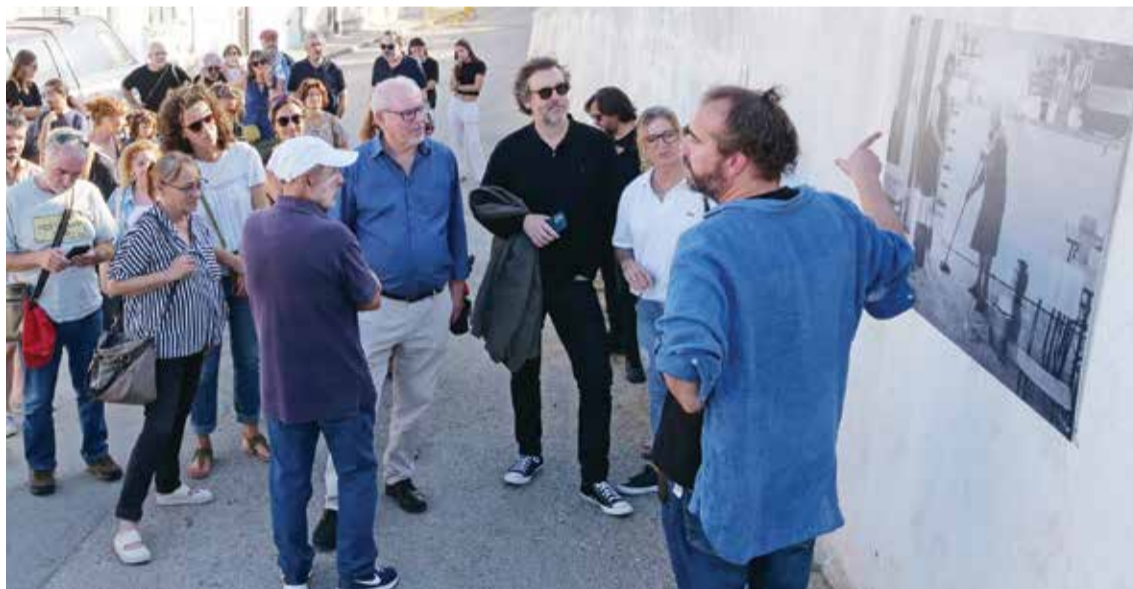
O direito à habitação foi exposto nos muros do Bairro Grito do Povo, no âmbito de um projeto com diversas atividades

O programa de dia 14 contemplou, à tarde, o XX Festival de Bandas Filarmónicas da Cidade de Setúbal, com um desfile pelas ruas da Baixa comercial e um concerto na Praça de Bocage, em que participaram a Banda da Sociedade Musical Capricho Setubalense e a Banda Municipal de Música de Arenas de San Pedro, de Ávila, Espanha. A partir do fim da tarde, as comemorações centraram-se