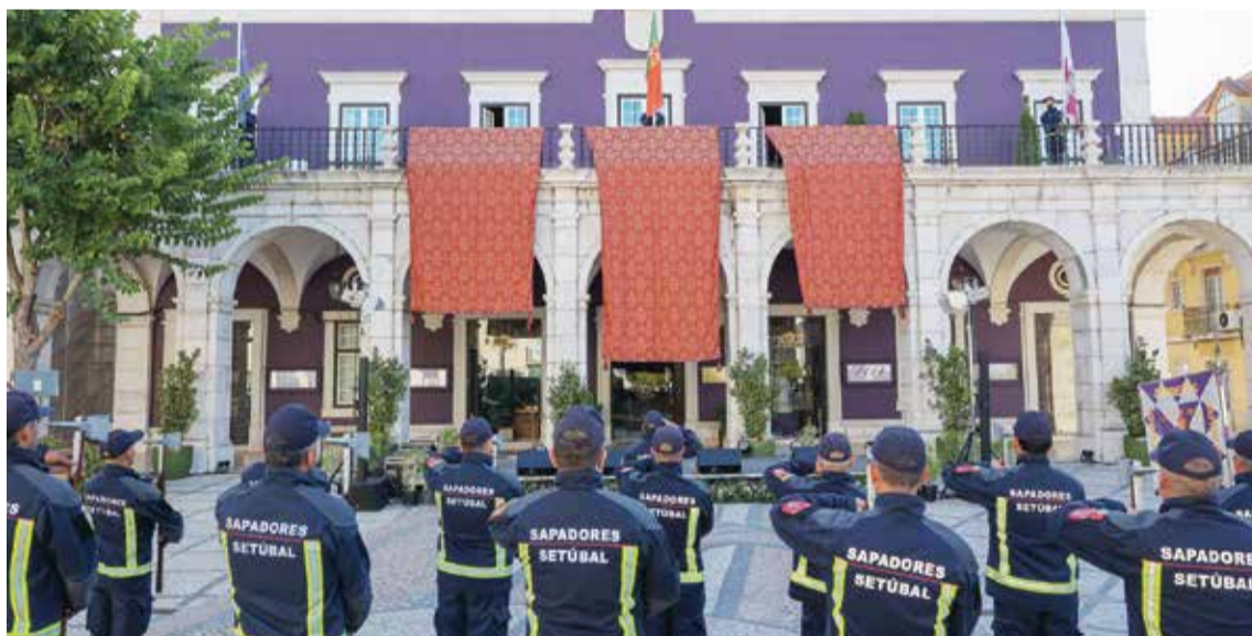
As comemorações do Dia da Cidade começaram com o hastear da bandeira