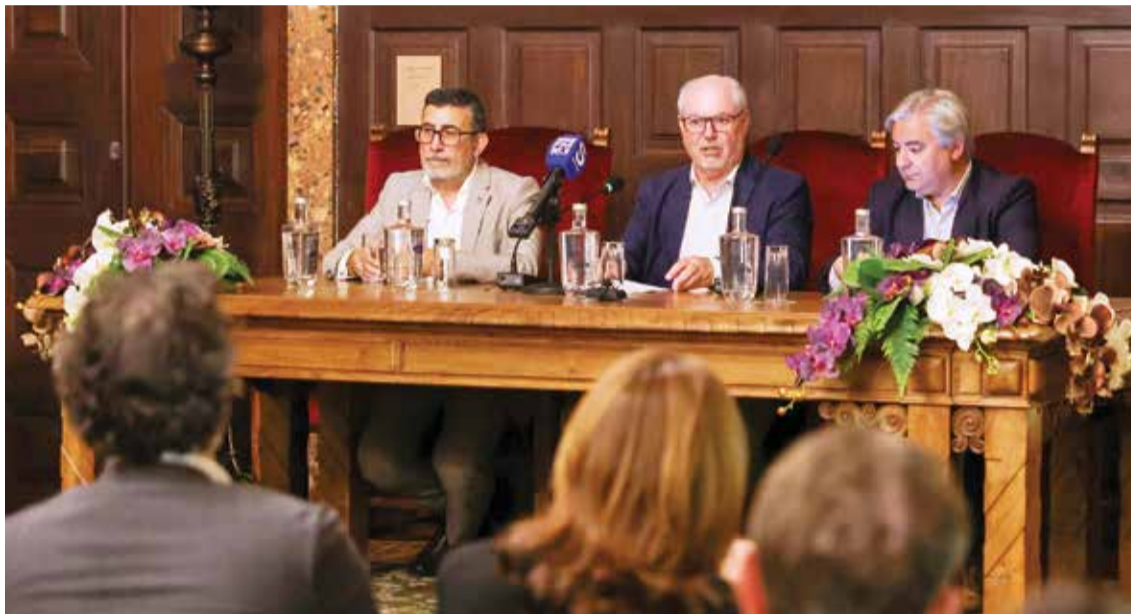
Setúbal, Palmela e Sesimbra reclamam melhores cuidados de saúde

À ministra, pedem uma reunião para encontrar soluções para resolver problemas urgentes