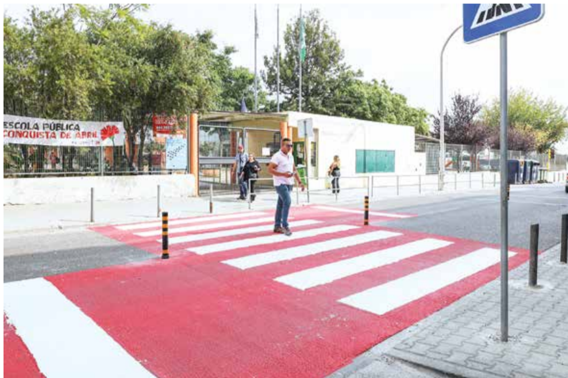
A passadeira junto da entrada da Escola Básica Luísa Todi recebeu um reforço de segurança

A passadeira junto da entrada da Escola Básica Luísa Todi, além