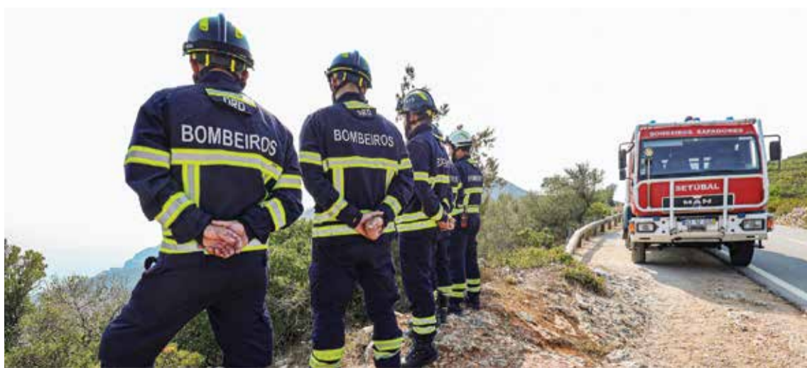
A vigilância do Parque Natural da Arrábida foi reforçada

posição de limitações de uso nesta área protegida, com a proibição da utilização dos parques de merendas da Comenda e do Alambre, foram medidas adotadas. A comissão fez várias reuniões de acompanhamento e balanço da situação verificada no concelho, não havendo registo de ocorrências relevantes em termos de fogos rurais.