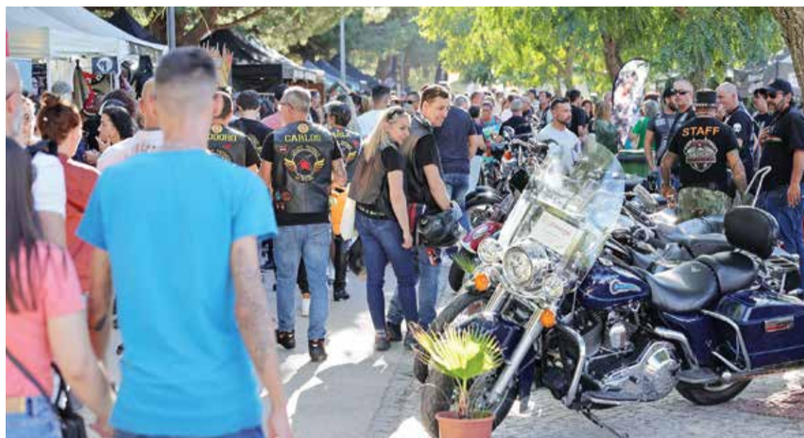
As motos estacionadas na Praia da Saúde despertaram a curiosidade dos visitantes

O Setúbal Custom Weekend não desilude e, nesta nona edição, voltou a atrair uma multidão à frente ribeirinha.