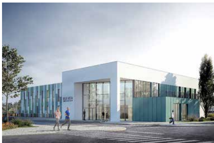
A nova unidade de saúde primária é criada num edifício contemporâneo

O programa funcional é desenvolvido num projeto do tipo 5B, em que se inclui uma Unidade de Recursos Assistenciais Par-