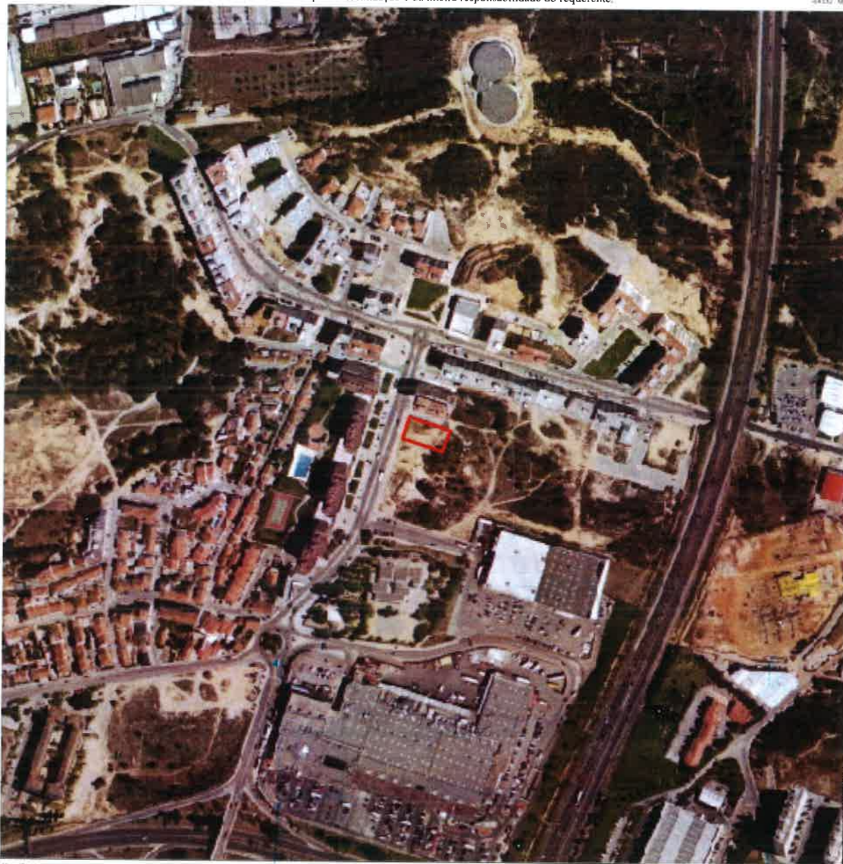
Cartografia 1/10 000 da Câmara Municipal de Setúbal (2005) | ETRS89/PT-TM06 | Projeção Transversa de Mercator | Elipsóide GRS80

A identificação da localização é da inteira responsabilidade do requerente.