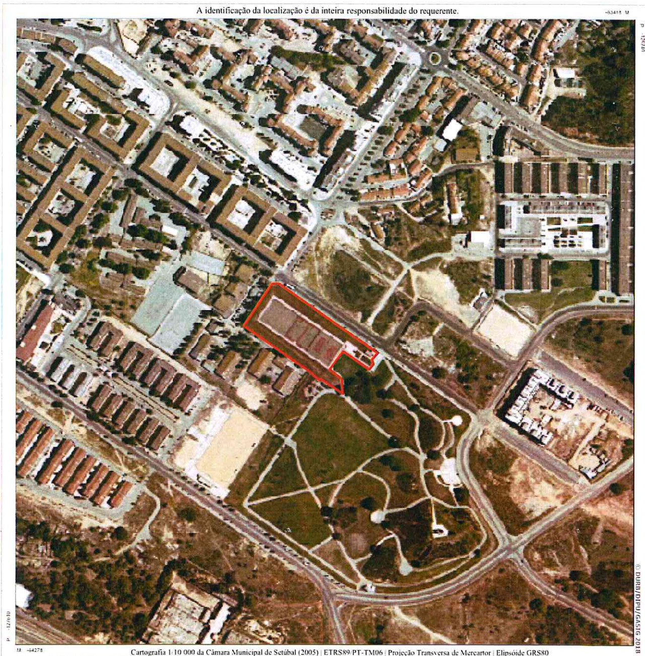
Cartografia 1:10 000 da Câmara Municipal de Setúbal (2005) | ETRS89 PT-TM06 | Projeção Transversa de Mercator | Elipsóide GRS80

A identificação da localização é da inteira responsabilidade do requerente.