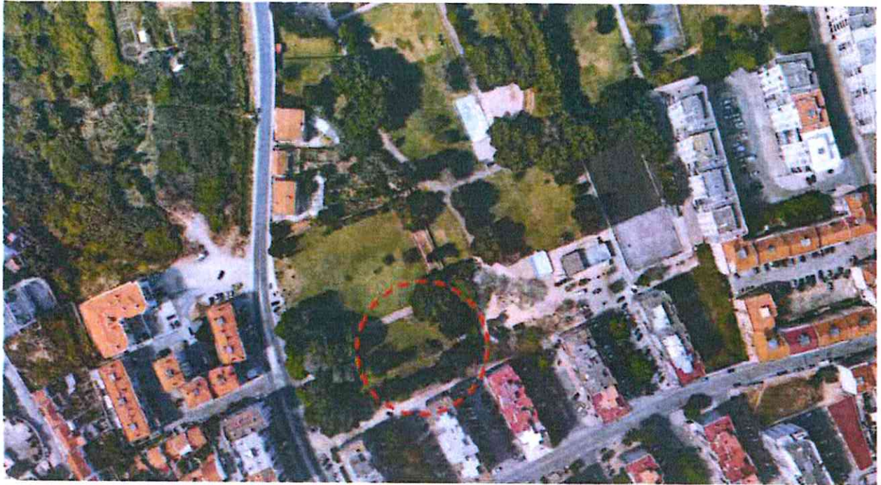
Imagem aérea da aplicação Google Earth