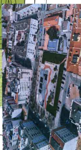
PROPOSTA DE LOCALIZAÇÃO DO QUIOSQUE PARQUE AFONSO COSTA - GARIU - FEV/2020