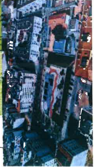
PROPOSTA DE LOCALIZAÇÃO DO QUIOSQUE PARQUE AFONSO COSTA - GARIU - FEV/2020