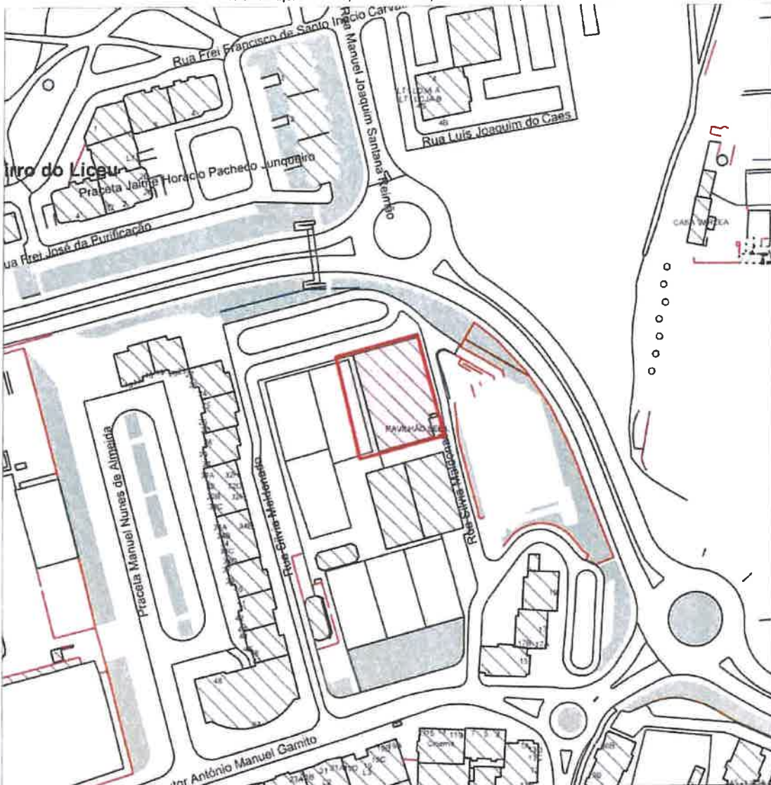
A identificação da localização e da interna responsabilidade do requerente

Cartografia 1/10000 da Câmara Municipal de Setúbal (2014) - ETRS89/PT-TM06 - Projeção Transversa de Mercator | Elipsóide GRSS0