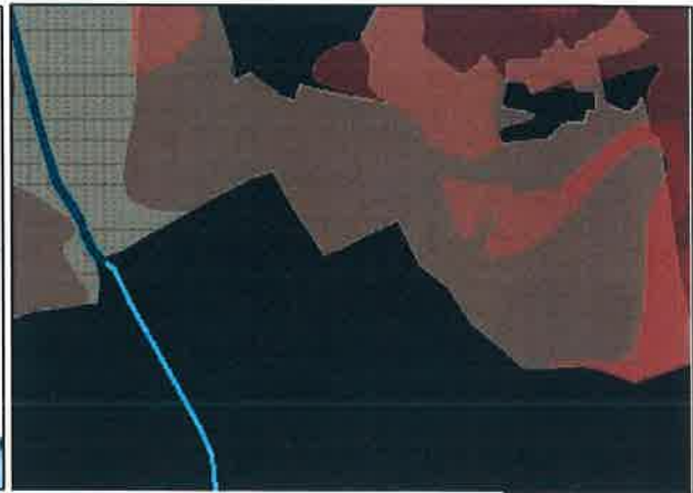
RPDM Barreiro – Proposta RAN bruta