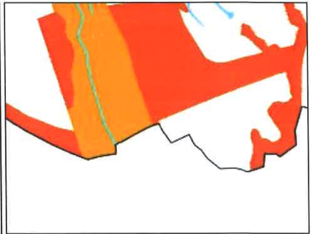
RPDM Barreiro – Proposta da EEM