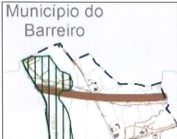
RPDM Setúbal – Proposta RAN bruta

No que diz respeito á RAN bruta, verifica-se compatibilidade com o que está definido na RAN bruta para concelho do Barreiro, continuidade territorial na área da Várzea de Coina.