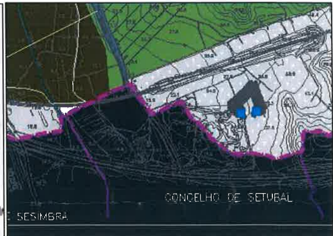
RPDM Barreiro – Proposta RAN bruta