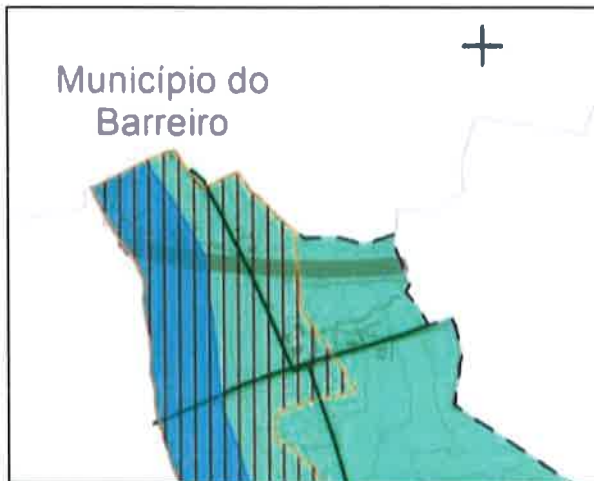
RPDM Setúbal – Proposta da EEM

Várzea do Coina, no restante território de limite administrativo, não existe para o concelho do Barreiro proposta de EEM, visto que se trata de uma atividade económica - Areeiro, classificado como um espaço de exploração de recursos geológicos, este território apenas poderá ser reconvertido e integrado na EEM, aquando da desativação desta atividade e implementado do respetivo Plano de Recuperação Ambiental.