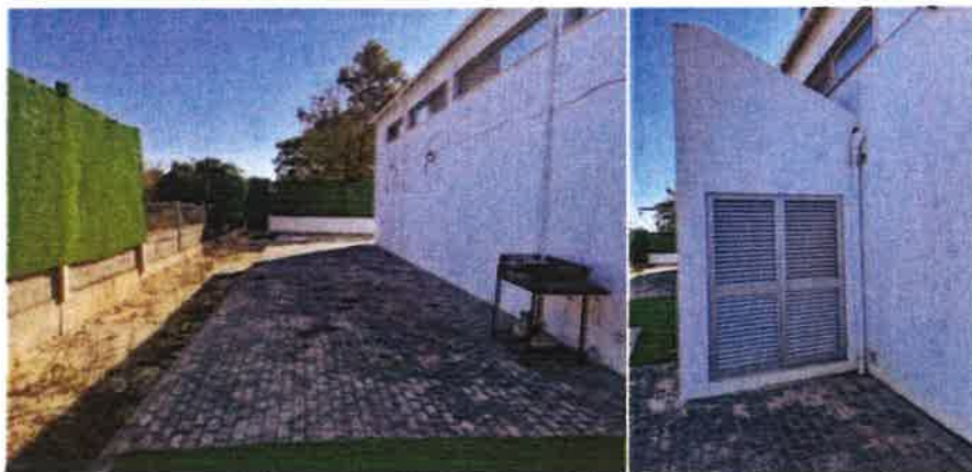
Foto 10 e 11 – Terreno a tardoz da moradia e localização do termoacumulador