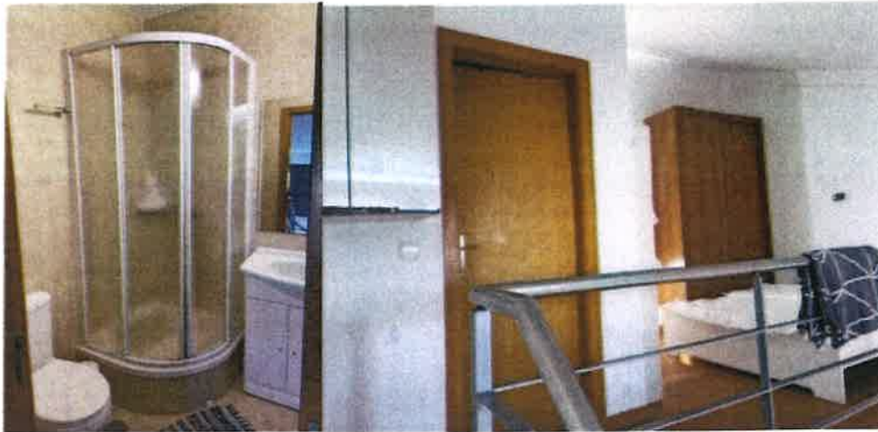
Foto 15 ,16, 17 e 18 – Pequeno apartamento com 1 quarto, uma IS e sala com kitchenette