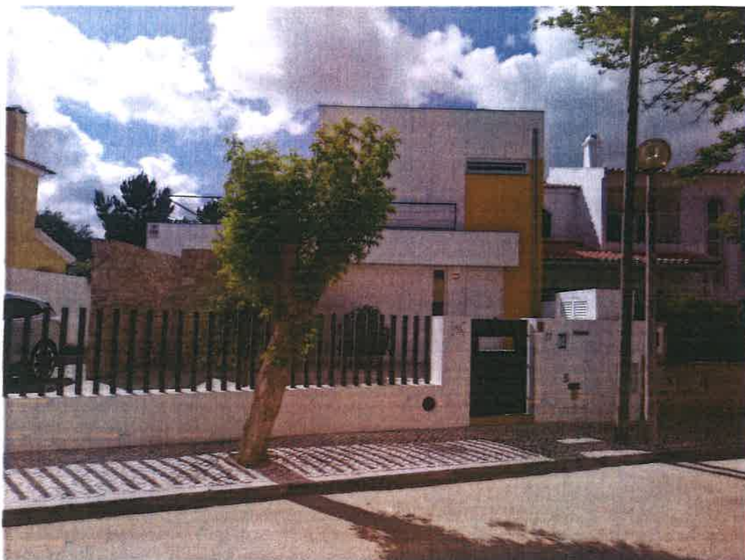
Foto 1 - Edifício onde está instalado o Alojamento Local