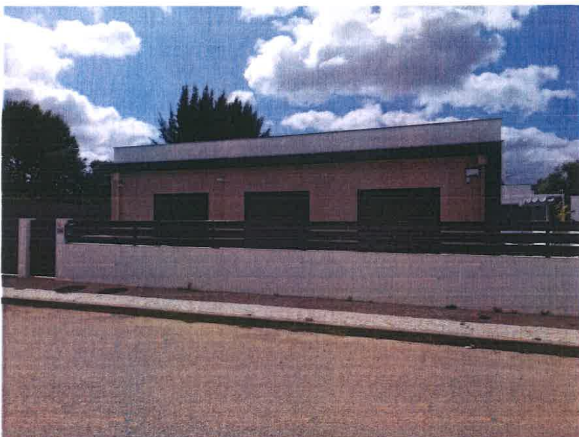
Foto 1 - Edifício onde está instalado o Alojamento Local