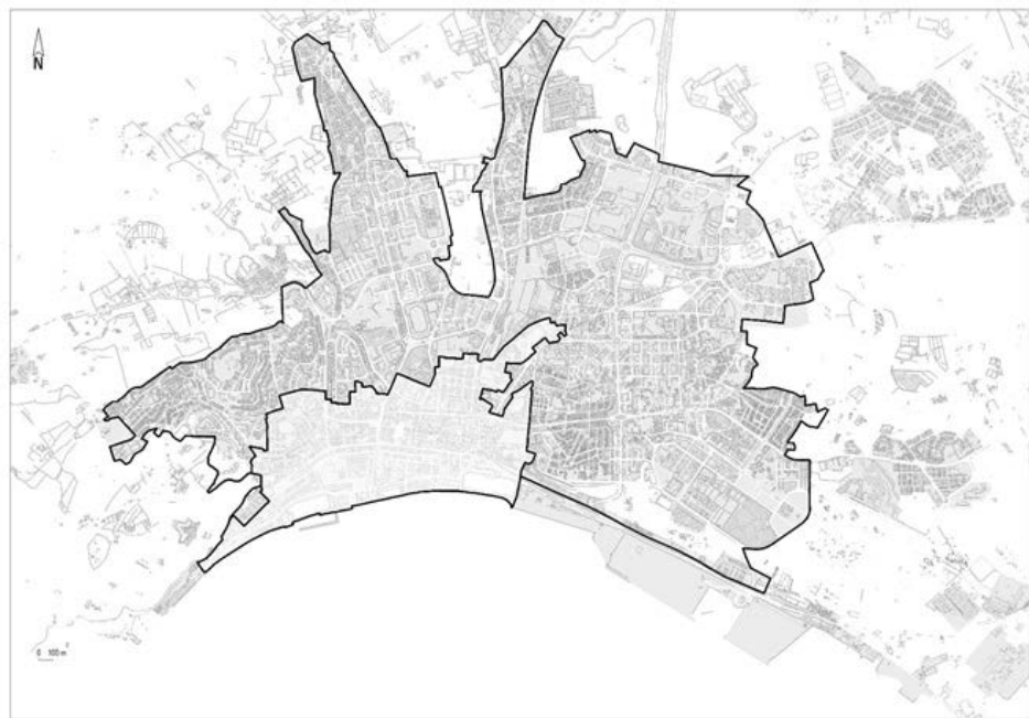
Figura 1 - Enquadramento da ARU Setúbal existente e da ARU Setúbal Central proposta

de contingentes imigratórios de maior expressão, que não foram acompanhados por um processo de planeamento urbanístico integrado, capaz de dar resposta às necessidades de crescimento da cidade e da sua população. Assistimos assim a um crescimento urbano fragmentado e ao longo dos principais eixos viários existentes, onde hoje é possível constatar a existência de áreas territoriais, de cariz pós-industrial, que respondem aos critérios que estiveram subjacentes à delimitação atualmente existente, nomeadamente, quanto à insuficiência, degradação ou obsolescência dos edifícios, no que se refere às suas condições de uso, solidez, segurança, estética ou salubridade, que também já por si, justificam uma intervenção integrada, motivos pelos quais se considera fundamental a delimitação de uma nova área de reabilitação a designar como Área de Reabilitação Urbana de Setúbal Central.