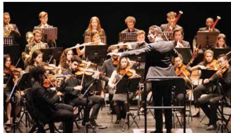
Orquestra Académica Metropolitana com Conservatório Regional