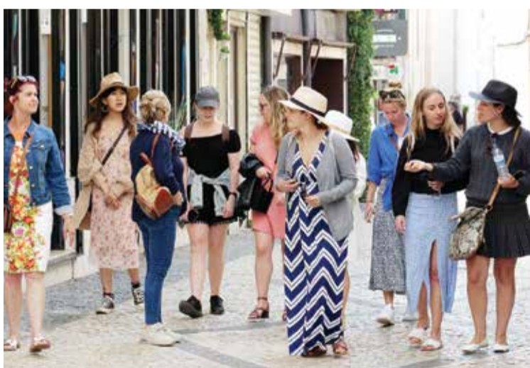
A procura turística tem crescido significativamente em Setúbal

Depois de em 2021 as viagens domésticas terem impulsionado a melhoria do setor a nível nacional, “regressou em 2022 a