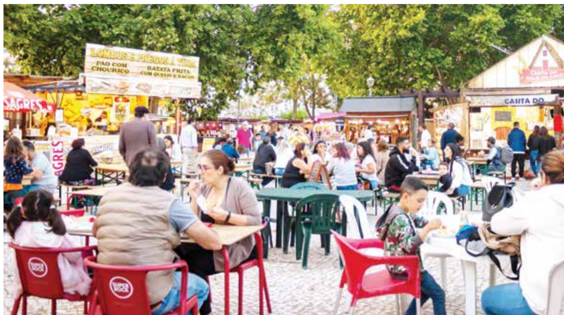
A gastronomia foi um dos destaques desta festa que se realizou no Jardim do Monte Belo

■ Divertimentos, jogos tradicionais, modelagem de balões, pinturas faciais e animação musical foram atrativos da Festa da Criança, a 3 de junho no Parque Urbano Bacalhôa II, numa iniciativa da Junta de Freguesia de Azeitão, com várias parcerias, para assinalar o Dia Mundial da Criança. O evento contou com animação musical, atividades desportivas e de lazer como aulas de iniciação ao skate e de ioga, a par de workshops de crochet e de artesanato sustentável e de momentos lúdico-pedagógicos, de que foram exemplo os ateliers "Higiene Oral" e "Piolhos e Sol".