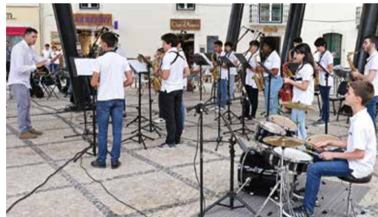
Os Sons na Cidade chegaram pela mão da Academia Luísa Todi