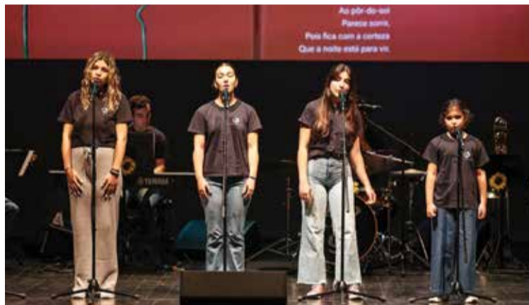
O concerto pedagógico Histórias de Cantar foi apresentado pelo Conservatório