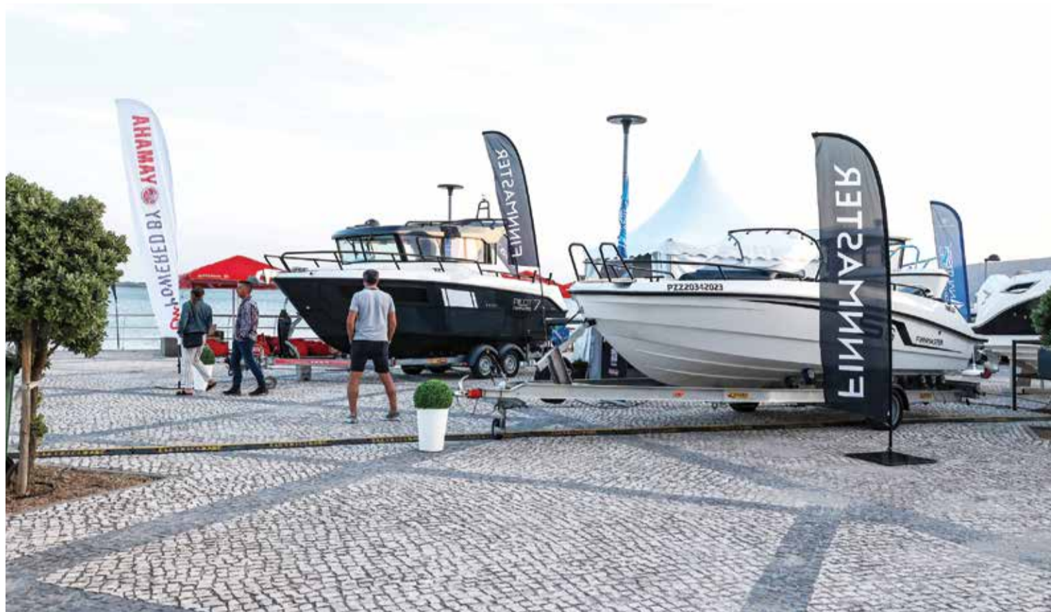
A Feira Náutica expôs embarcações de todos os tipos

CÂMARA MUNICIPAL ORGANIZA EVENTO GERADOR DE OPORTUNIDADE DE NEGÓCIOS