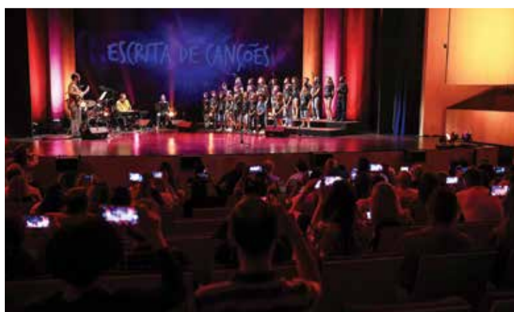
Escrita de Canções junta sete escolas básicas do concelho