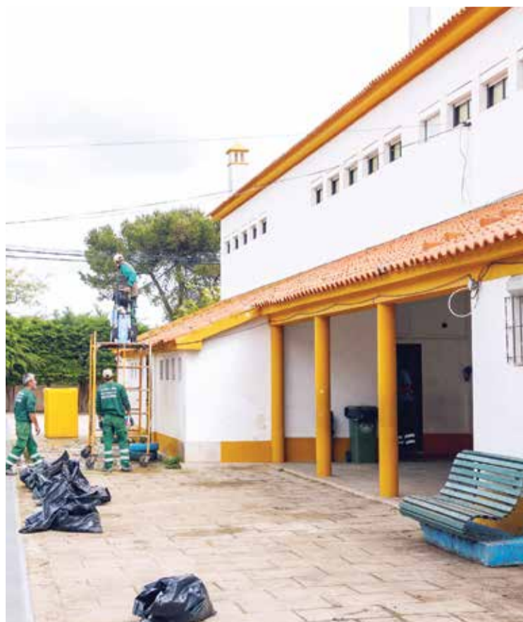
A cobertura da EB Nº 9 do Casal das Figueiras foi reabilitada

As intervenções foram executadas no âmbito da estratégia de delegação de competências da Câmara Municipal de Setúbal, com a transferência de respetivos recursos para a concretização das ações, na União das Freguesias de Setúbal.