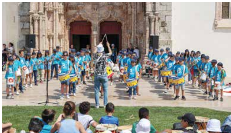
O desfile de percussão de abertura culminou num concerto