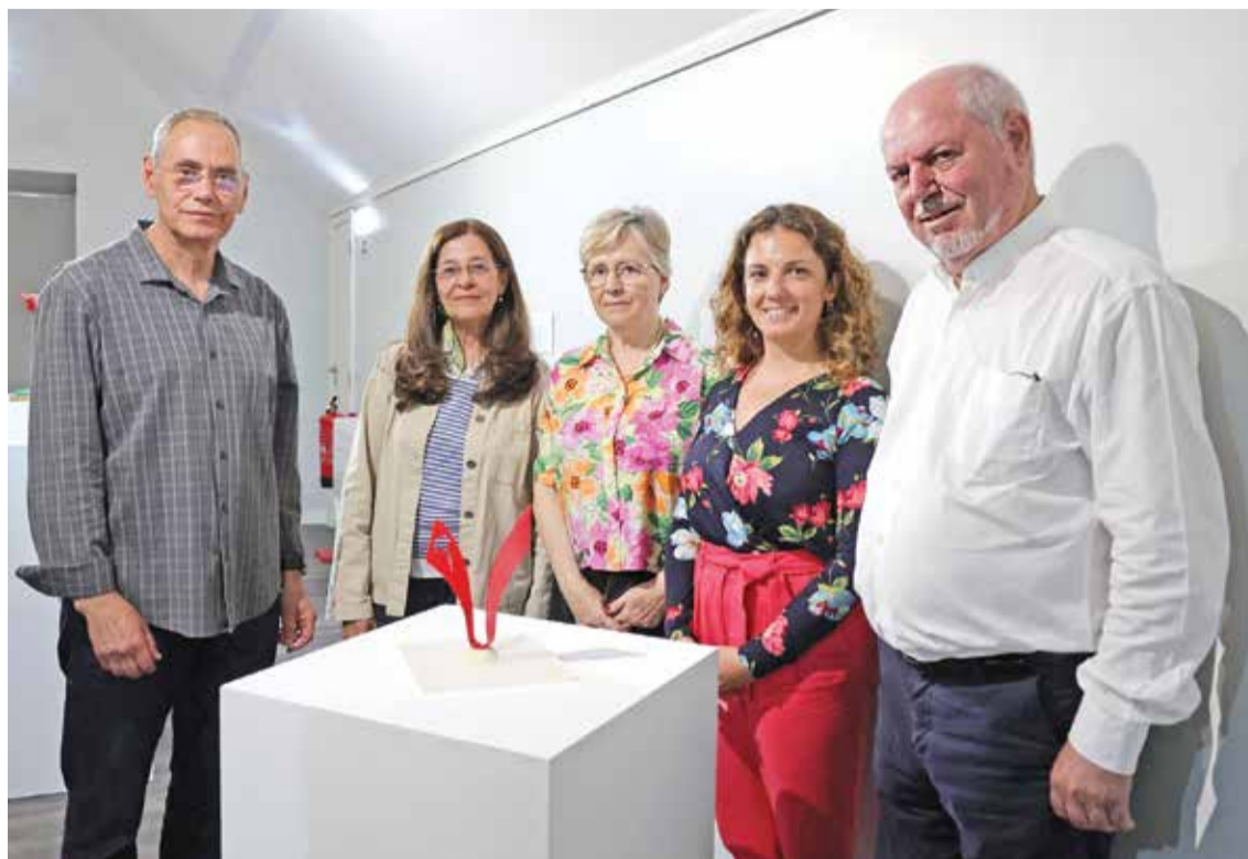
A forma da escultura é inspirada na canção "Somos livres (uma gaivota voava voava)"

AZEITÃO | ESCULTURA É INSTALADA NOS 50 ANOS DO 25 DE ABRIL