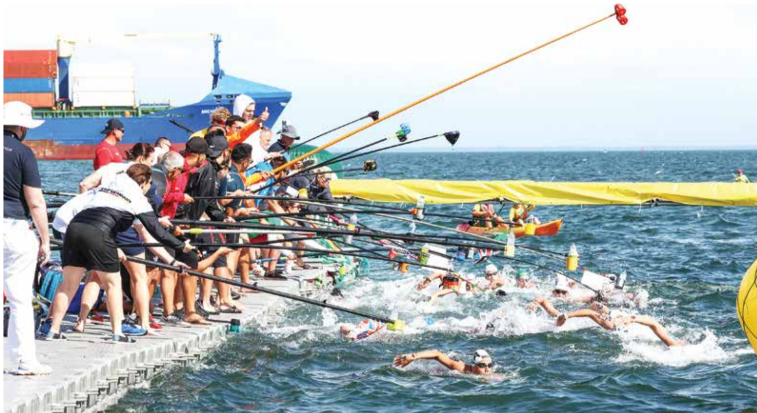
A etapa sadina da Taça do Mundo em Águas Abertas teve provas individuais, uma estafeta e um evento aberto

ÊXITO NA ORGANIZAÇÃO DE EVENTOS DESPORTIVOS DE ALTA COMPETIÇÃO