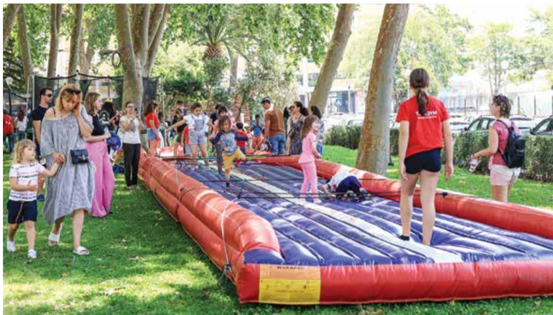
O “Há Festa no Parque” proporcionou momentos de animação e convívio entre as famílias

Animações diversas, exposições, música, dança, teatro e boa disposição não faltaram na 15.ª edição do “Há Festa no Parque”. O evento proporcionou o convívio e a boa disposição em família