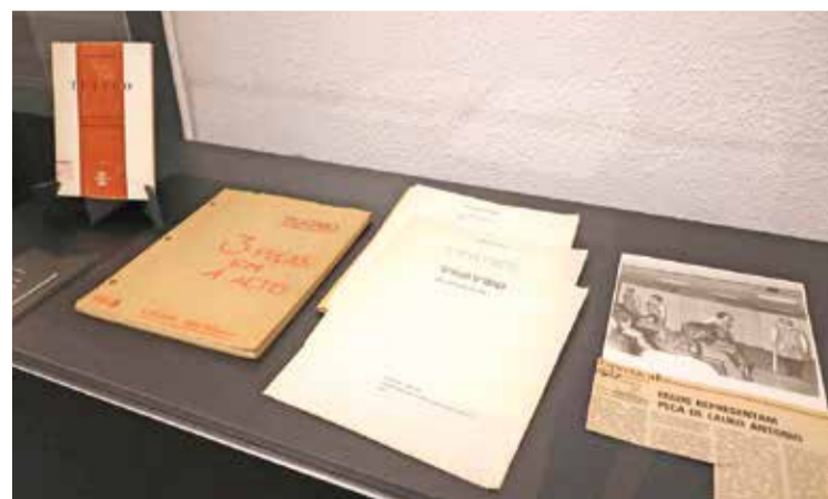
Mostra inaugurada na Noite Europeia dos Museus

As peças de teatro originais manuscritas e datilografadas, recortes de imprensa, fotografias de cena, o caderno de Lauro António com desenhos e anotações de cena, o cartaz e outros mate-