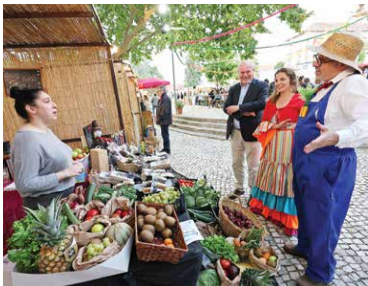
Produtos da Arrábida foram atrativos da Festa do Manel da Horta

O mel, os enchidos, os doces, os licores, a fruta e os legumes foram destaques do certame organizado pela Junta de Freguesia de Azeitão, com o apoio da Câmara Municipal de Setúbal, tal como o artesanato e as tasquinhas gastronómicas. Na inauguração, com a