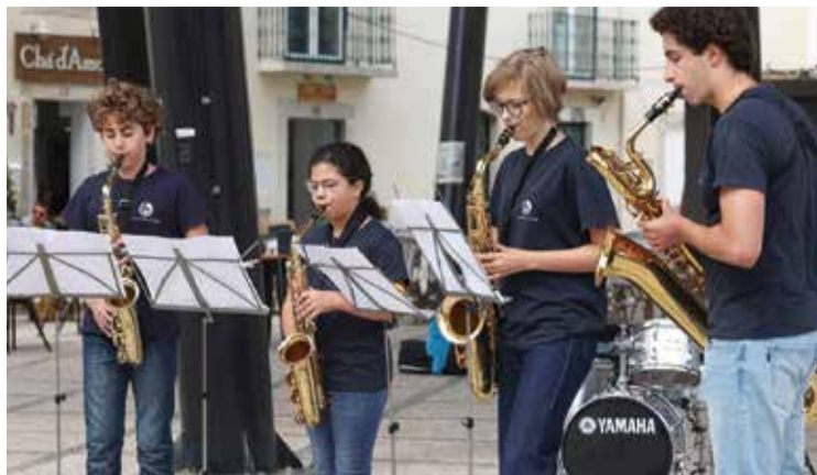
Houve Sons da Cidade pelo Conservatório Regional de Setúbal