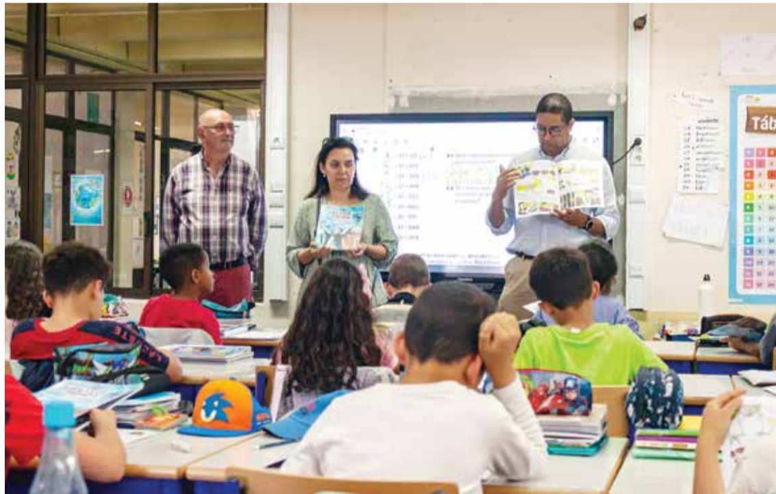
O livro de ilustrações foi oferecido às crianças da freguesia

conhece bem o que significou a revolução de 25 de Abril e como viviam os portugueses antes dessa data.