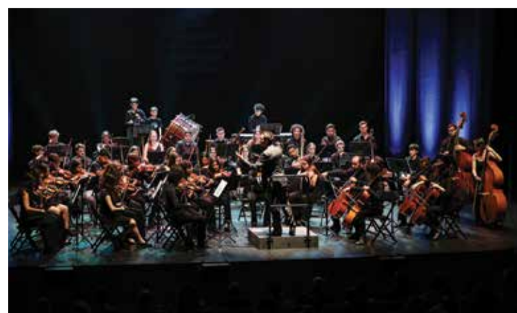
Orquestra Sinfónica do Festival Internacional de Música de Setúbal