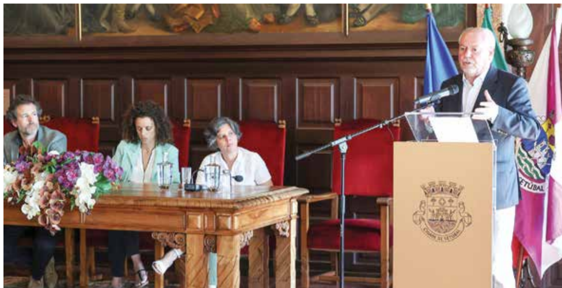
O presidente entende que os partidos políticos devem pronunciar-se sobre os tarifários cobrados na gestão de resíduos

Desde a privatização da EGF, empresa de tratamento e valorização de resíduos em Portugal, integrada na Mota Engil em 2014, ficando esta com 51 por cento dos capitais da Amarsul, “a responsabilidade social do serviço público passou a ter como determinante a obtenção do lucro”. Assim se explica, acrescentou o autarca, o “progressivo e insustentável aumento das propostas de tarifário impostos pela Amarsul aos municípios para