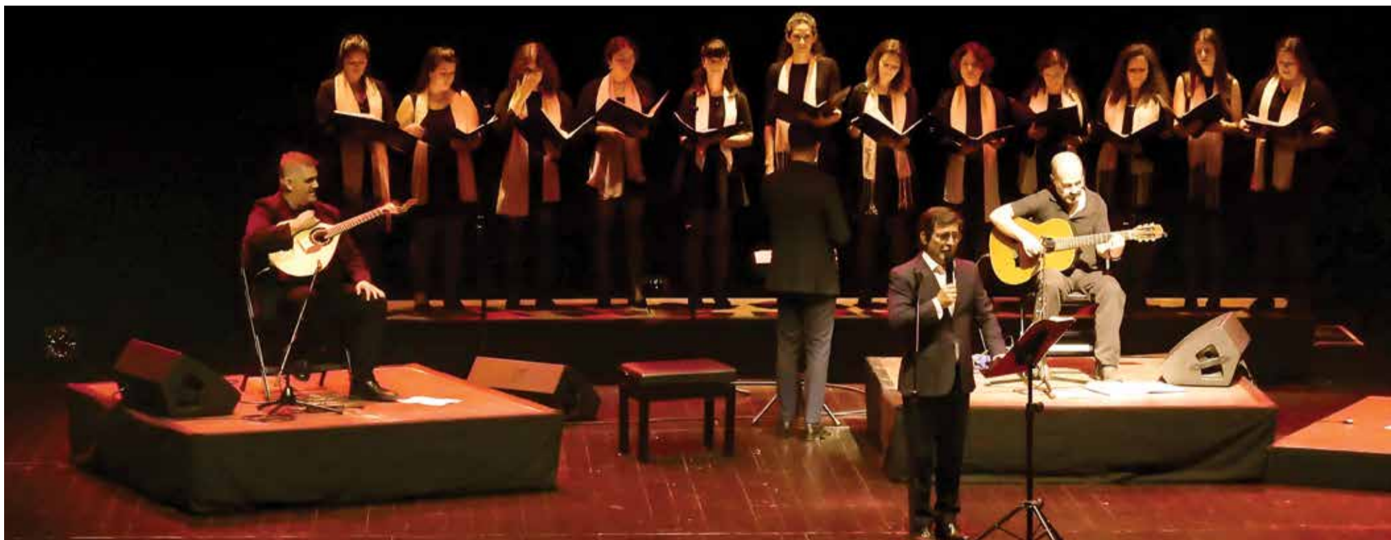
O Festival Internacional de Música de Setúbal junta artistas profissionais a músicos locais, neste caso Camané com os coros femininos do Conservatório Regional de Setúbal e TuttiEncantus

FESTIVAL INTERNACIONAL DE MÚSICA DE SETÚBAL DURANTE DEZ DIAS