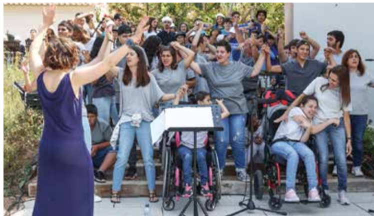
APPACDM, Academia Luísa Todi e Conservatório Regional de Palmela