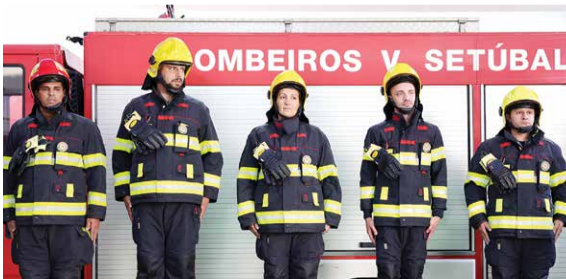
A Equipa de Intervenção Permanente possui elevada especialização e competências em áreas diferenciadas

As EIP são formadas por cinco bombeiros profissionais, com elevada especialização e com competências em áreas diferenciadas para atuarem em diferentes cenários, os quais estão disponíveis oito horas por dia. A Câmara Municipal e a ANEPC financiam, em partes iguais, os salários e encargos dos elementos dos bombeiros, cabendo à associação “suportar uma parte considerável dos custos de funcionamento”, que, segundo o presi-