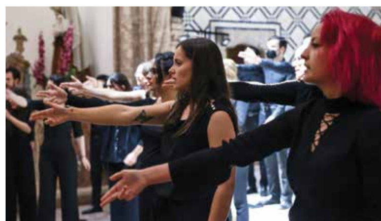
Ensemble Vocal Nova Era com a Academia Escola de Música de Almada