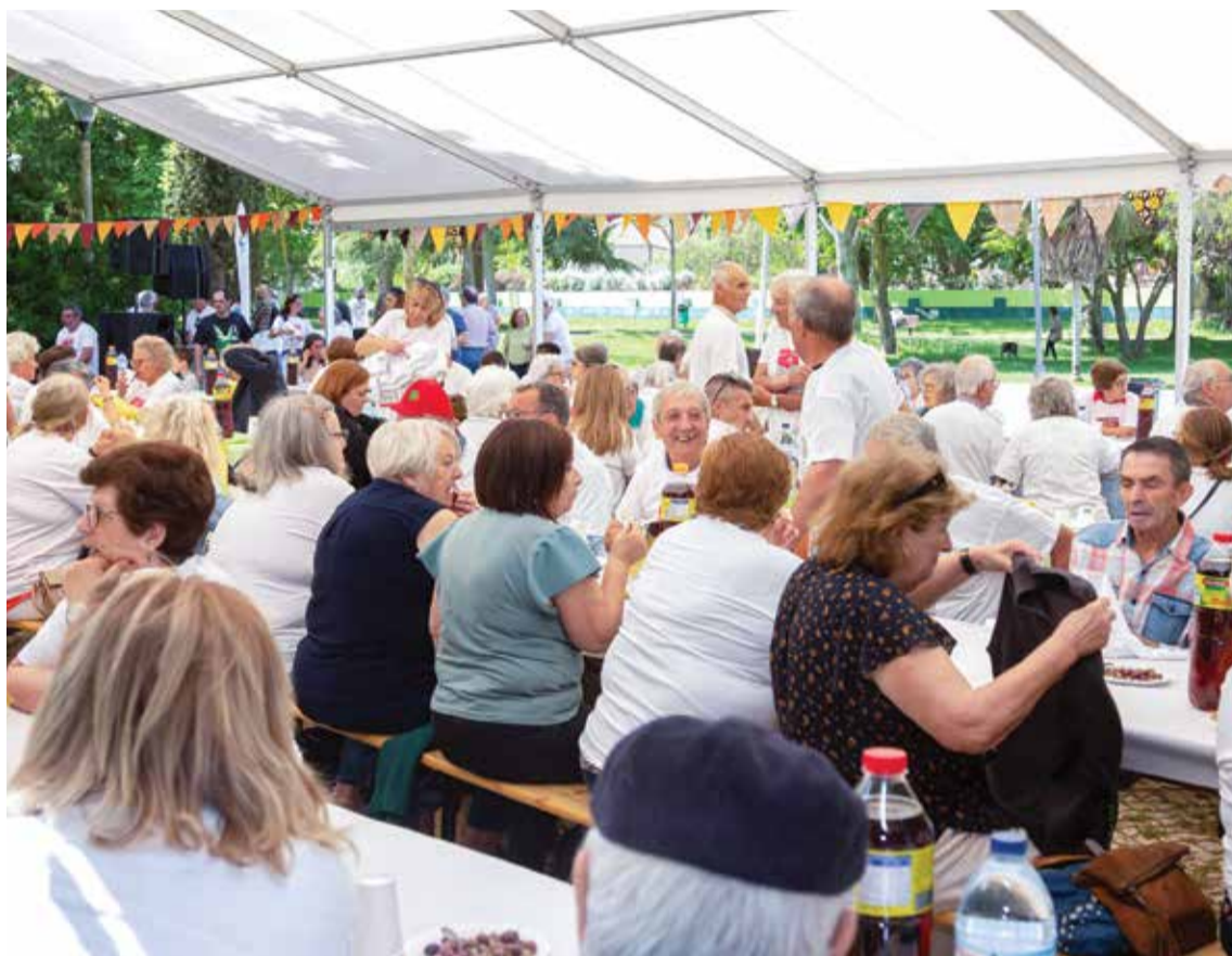
Mais de 350 pessoas, de diferentes gerações, participam no Piquenique e Arraial da Liberdade

Mais de 350 pessoas, de diferentes gerações, participam na iniciativa organizada com o apoio da Câmara Municipal de Setúbal, a qual foi marcada por uma festa intensa em ambiente de convívio e de camaradagem. Além do repasto oferecido à população pela Junta, a animação musical deu mais ritmo à festa, com atuações do Trio Abel Geada, da Banda do Andarilho e do grupo de percussão Sem (In) diferenças da APPACDM de Setúbal. Houve ainda pintura com o Atelier Espaço Colibri, karaté