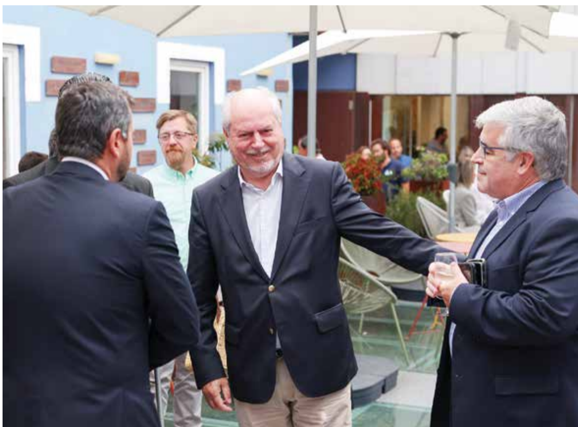
A Câmara Municipal e os agentes turísticos estão alinhados na estratégia de reforço do mercado de Setúbal

O turismo em Setúbal prossegue a tendência de crescimento, com os indicadores do primeiro trimestre do ano a revelarem um aumento de 60 por cento da procura. A capacidade de resposta dos operadores turísticos e a estratégia municipal de promoção estão na origem dos resultados