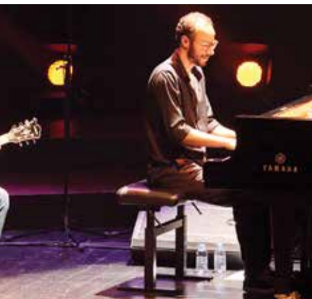
atuaram com o Coral Infantil e a Capricho