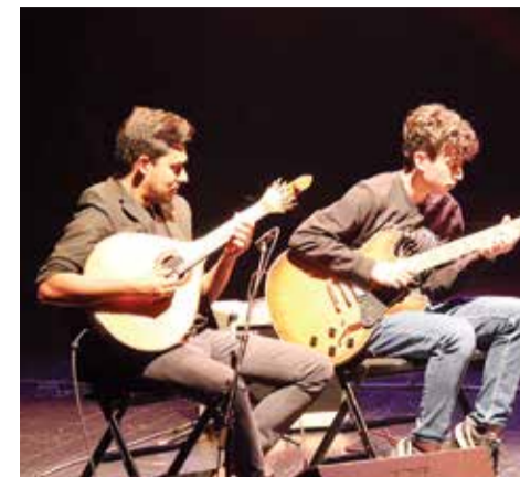
Júlio Resende e o Fado Jazz Ensemble