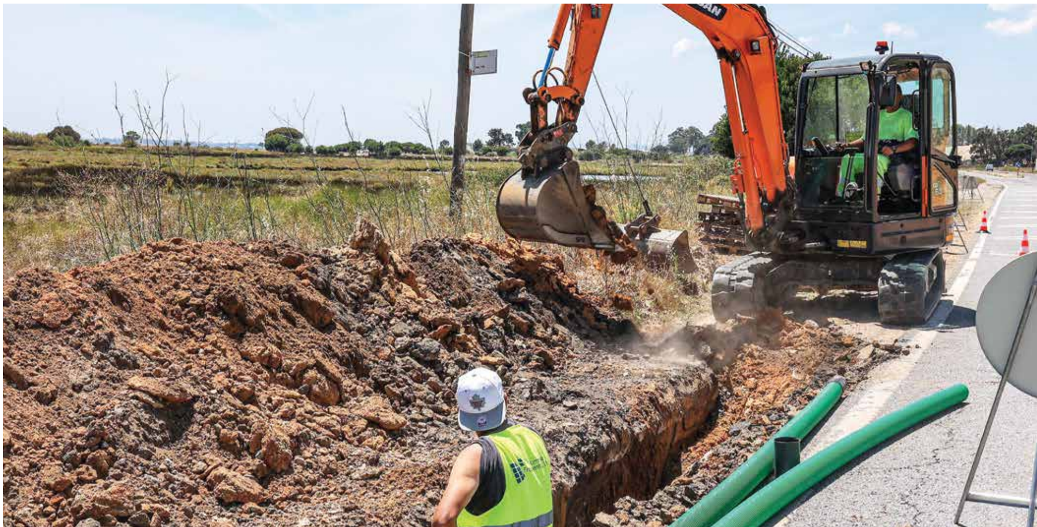
A requalificação da Estrada da Mitrena já se encontra em obra, um investimento de perto de quatro milhões de euros

QUATRO PROJETOS EM VÁRIAS ÁREAS DO CONCELHO