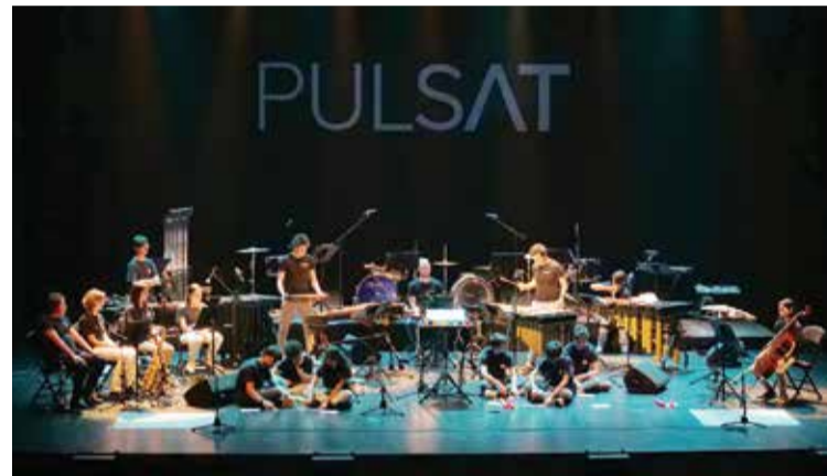
Pulsat Percussion Group com alunos do Conservatório Regional de Setúbal