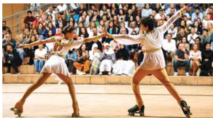
Patinadores mostraram criatividade artística sobre rodas

Cerca de meia centena de jovens patinadores marcaram presença no tradicional evento do clube sadino, que assinalou 19 anos