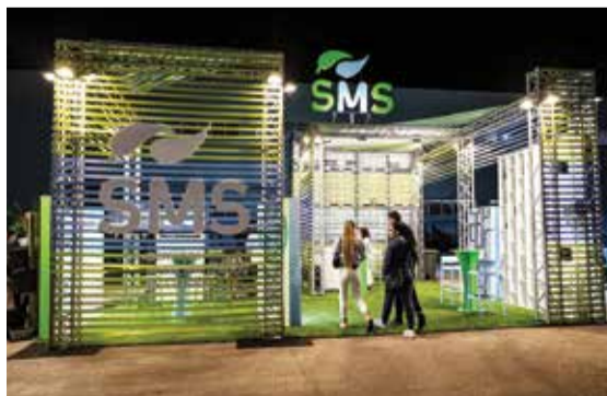
Os Serviços Municipalizados deram-se a conhecer melhor