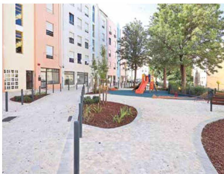
A ligação entre duas ruas tornou-se num espaço mais atrativo

vimentos, a implementação de uma pequena rampa de ligação entre as duas ruas e a realização de intervenções de melhoria da acessibilidade a lojas, armazéns e garagens. Os trabalhos contemplaram, igualmente, a melhoria do acesso rodoviário aos edifícios e a limitação da circulação a um sentido único e a emergências no espaço de ligação entre as duas ruas. O reordenamento das áreas de estacionamento automóvel foi outro objetivo, com a definição de bolsas de estacionamento, incluindo lugares para pessoas