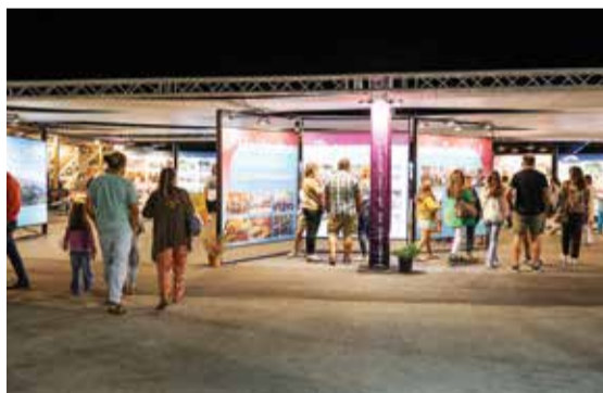
As juntas de freguesia mostraram o trabalho desenvolvido