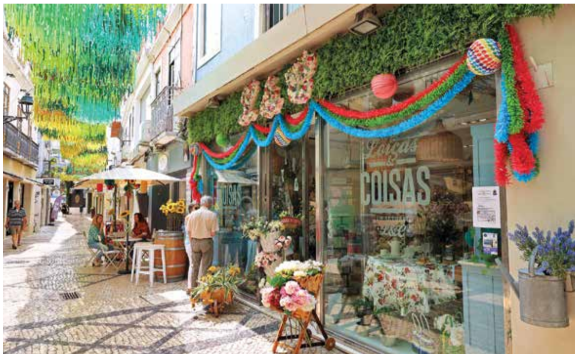
O projeto prevê a modernização e o marketing digital, a revitalização económica e o reforço da competitividade

Um projeto lançado pela autarquia, de 1,3 milhões de euros, com financiamento europeu do PRR, vai dotar as zonas comerciais do centro histórico de meios digitais e tecnológicos. Esta modernização sem precedentes visa reforçar a competitividade empresarial