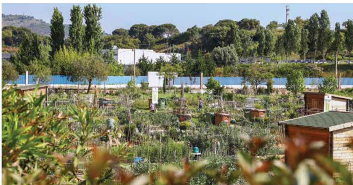
Setúbal tem diversas hortas urbanas destinadas a promover os circuitos curtos alimentares