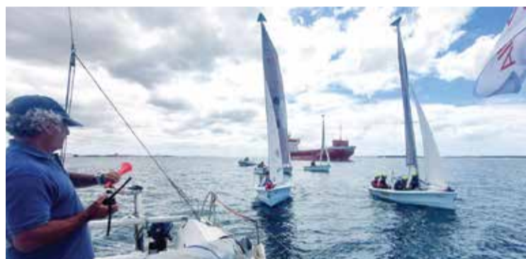
A Classe Bahia em competição no Troféu Santiago

Embarcações de várias classes, tripuladas por velejadores de diferentes gerações, fazem-se à água para dar mais colorido ao rio em competição. O Sado é um recurso natural privilegiado para a prática, ao longo de todo o ano, de desportos náuticos