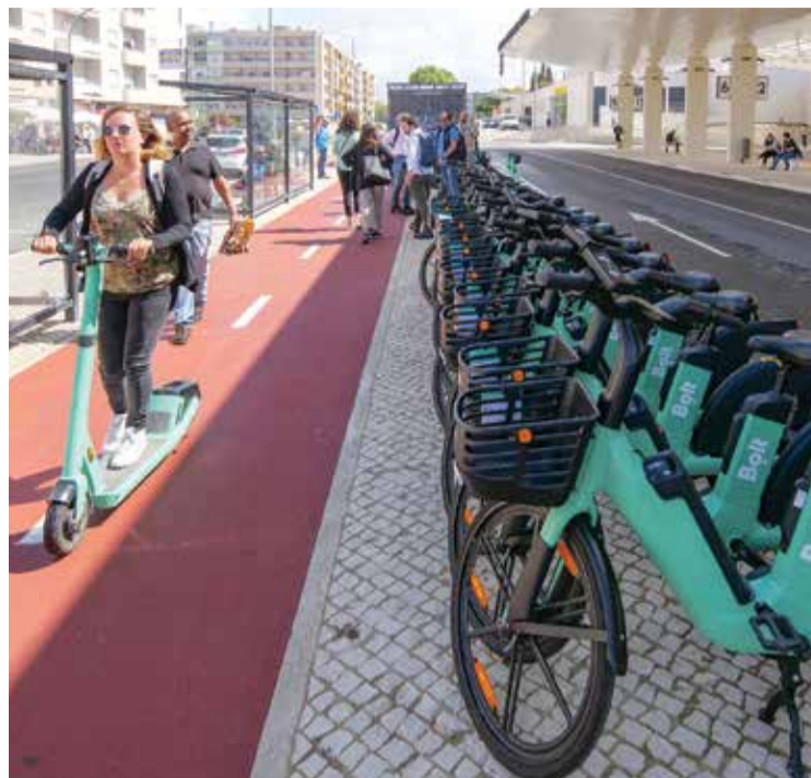
Na área da mobilidade, é promovida a utilização dos transportes públicos

O PLAAC-Arrábida, que pretende contribuir para o reforço da