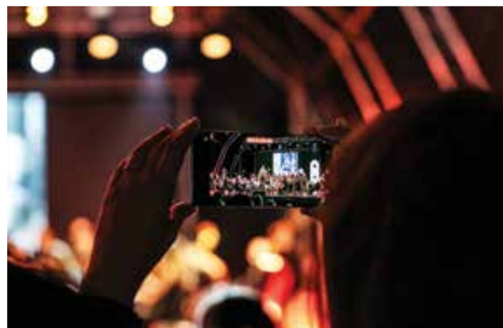
Concertos de excelência com registos para memória futura