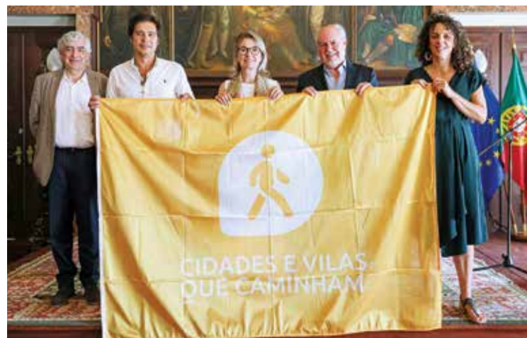
A Rede das Cidades e Vilas que Caminham fomenta a vertente pedonal