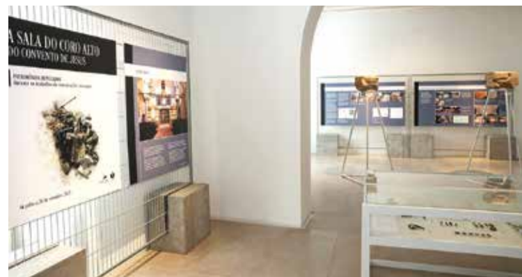
A exposição dá a conhecer o complexo trabalho de restauro do Coro Alto

Todas estas medidas vão ficar disponíveis ao público ainda durante o ano de 2023.