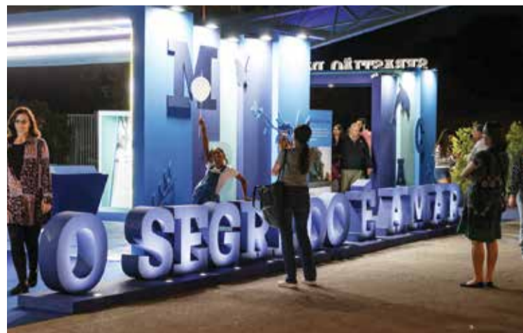
O pavilhão da Câmara de Setúbal celebrou os 100 anos de Sebastião da Gama