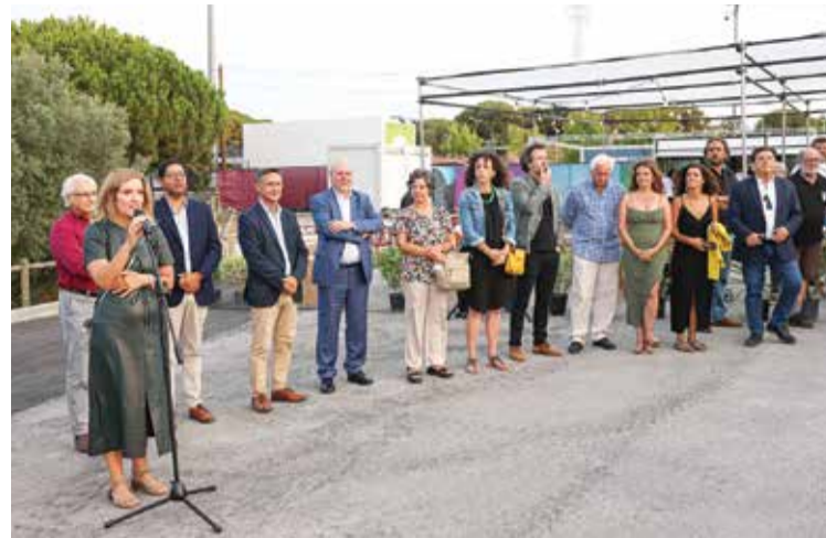
A Câmara Municipal conta com as juntas de freguesia para organizar o evento