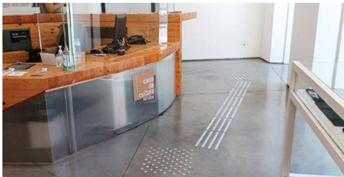
A Casa da Cultura é um dos equipamentos que já dispõem de pavimento tátil e mais medidas vêm a caminho

Uma intervenção desenvolvida no âmbito do projeto resultante de uma candidatura da Câmara Municipal de Setúbal a fundos europeus está a dotar os equipamentos culturais de soluções mais inclusivas. O objetivo é permitir o acesso dos cidadãos à cultura