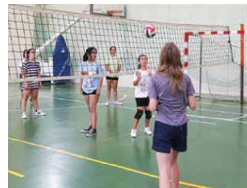
Houve à disposição diversos desportos coletivos