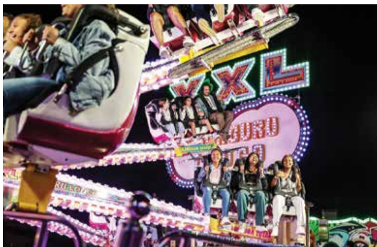
Os divertimentos proporcionaram entretenimento para todas as gerações