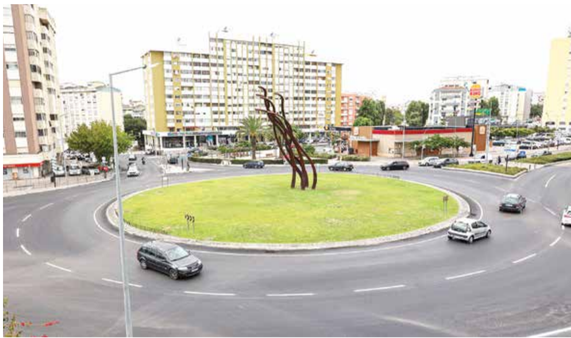
A Rotunda do Zéfiro foi um dos locais a receber novo pavimento

O investimento é uma parceria da Câmara de Setúbal com a Junta de Freguesia de São Sebastião, para trazer mais qualidade de vida ao território