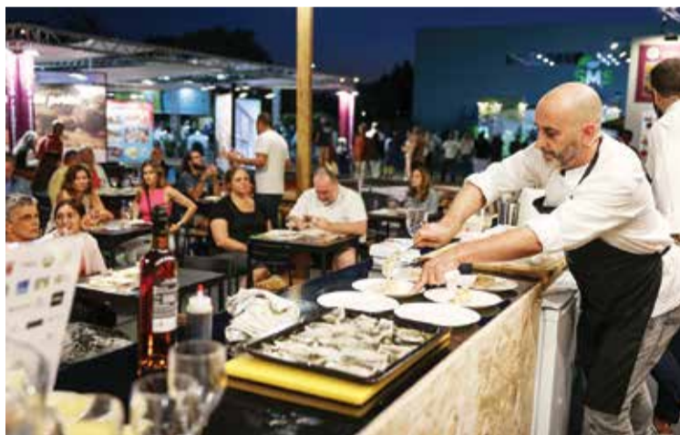
Sessões de showcooking deram a provar sabores da região e do mundo

Cultura, gastronomia e lazer marcaram a Feira de Sant'Iago, um evento organizado pela Câmara Municipal de Setúbal com espetáculos musicais gratuitos todas as noites. O centenário do poeta azeitonense Sebastião da Gama deu tema a esta edição, com um pavilhão expositivo