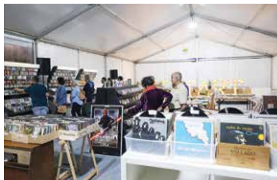
A Feira do Livro e do Disco foi uma das novidades