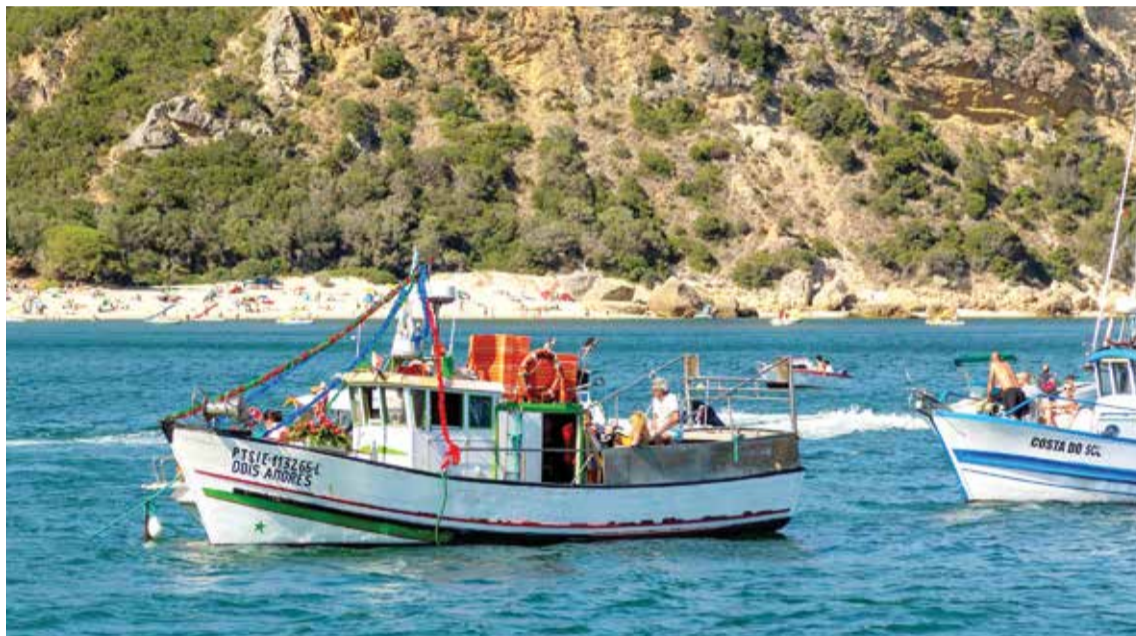
O círio marítimo com barcos engalanados cruzou o rio Sado entre a cidade e o Portinho da Arrábida

Barcos engalanados e com imagens religiosas a bordo cumpriram o tradicional cortejo marítimo entre a cidade e o Portinho da Arrábida nas Festas do Novo Círio de Nossa Senhora da Arrábida. A tradição de 131 anos esteve no Convento da Arrábida, com uma missa, procissão e convívio