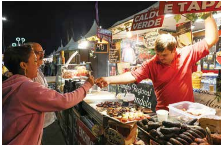
A gastronomia é sempre um dos atrativos da Feira de Sant'Iago