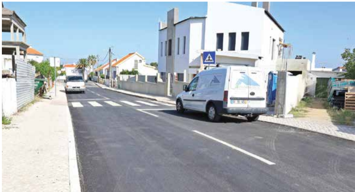
A infraestrutura urbana ficou completa no arruamento localizado em Vendas de Azeitão

■ A requalificação do troço nascente da Rua Alexandre Cardoso, em Vendas de Azeitão, ficou recentemente concluída, com uma intervenção para melhoria das condições de acessibilidade e aumento da segurança rodoviária e pedonal. A empreitada, no valor de mais de 30 mil euros, foi uma obra coerciva realizada depois de a Câmara de Setúbal ter acionado uma garantia bancária devido ao incumprimento de um promotor imobiliário. Acresceu a esta operação um conjunto de obras complementares para melhorar a infraestrutura enterrada, nomeadamente para reforço da rede de água, no valor de nove mil euros. A beneficiação do troço deste arruamento, com cerca de 70 metros de comprimento, deu resposta a solicitações dos moradores em matéria de infraestrutura urbana. A Rua Alexandre Cardoso