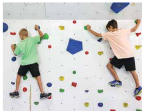
A escalada foi um dos 30 ateliers proporcionados