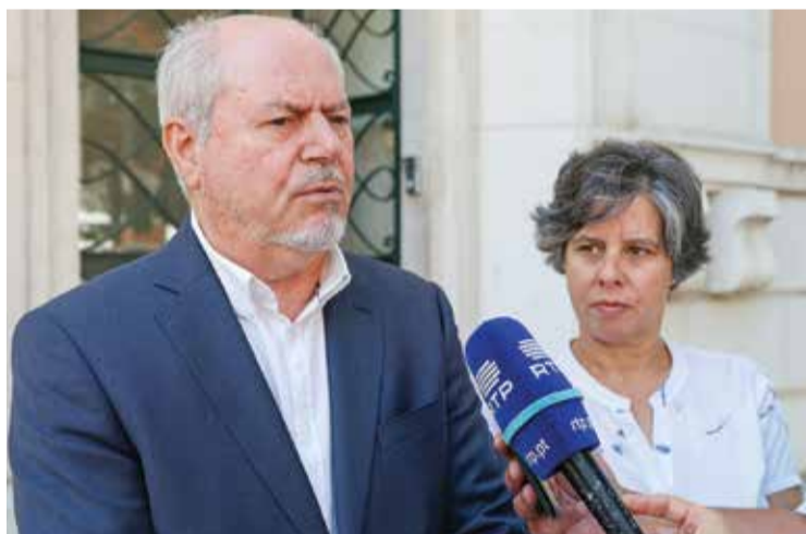
Presidente pediu ao Governo a reposição dos direitos laborais dos bombeiros

O presidente sublinhou que em causa estão 26 câmaras municipais com bombeiros profissionais, destacando que, no caso de Setúbal, é necessário que a situação "seja resolvida com a maior urgência", para que "a paz" regresse ao quartel da Companhia de Bombeiros Sapadores e fique garantido o empenho de todos na proteção e no socorro.