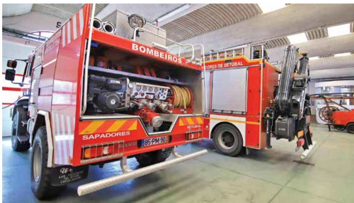
Os direitos da Companhia de Bombeiros Sapadores de Setúbal são considerados fundamentais

A Câmara Municipal de Setúbal está ao lado dos bombeiros sapadores na luta pelo direito às horas extraordinárias e ao subsídio de turno. O assunto já motivou um pedido para que o Governo altere a legislação e mereceu a intervenção do Presidente da República