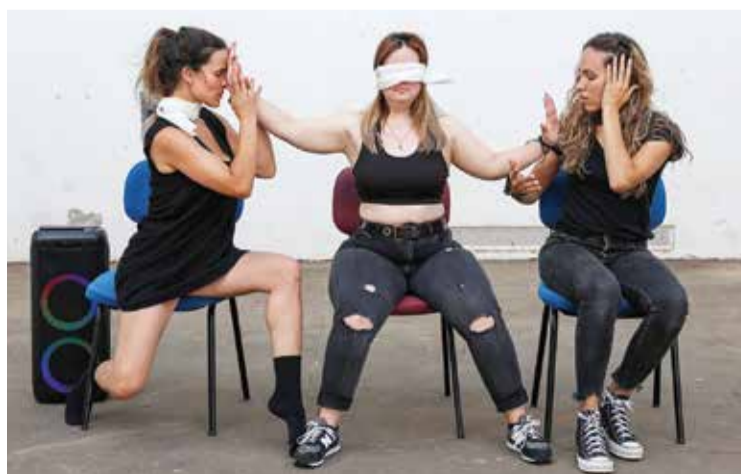
O encontro contou com vários apontamentos culturais

Na abertura do encontro “Inclusão a Torto e a Direito – Os Atuais Desafios da Escola para Todos”, organizado pelo Centro de Recursos para a Inclusão da APPACDM de Setúbal, com o apoio do município, na Escola Básica e Secun-