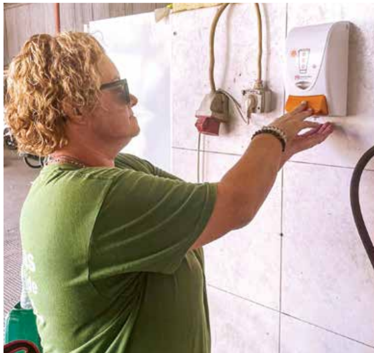
A Junta disponibilizou doseadores com protetor solar

■ A União das Freguesias de Setúbal, no âmbito do compromisso assumido em matéria de bem-estar dos trabalhadores, em particular no que respeita às equipas operacionais, implementou recentemente um conjunto de medidas promotoras de uma maior proteção solar. Nesta matéria, a Junta disponibilizou em instalações doseadores de protetor solar, especialmente concebidos para funcionários que, em função do tipo de atividades, são expostos a períodos de maior incidência solar. O protetor solar fornecido, com fator de proteção 50, é específico para esta