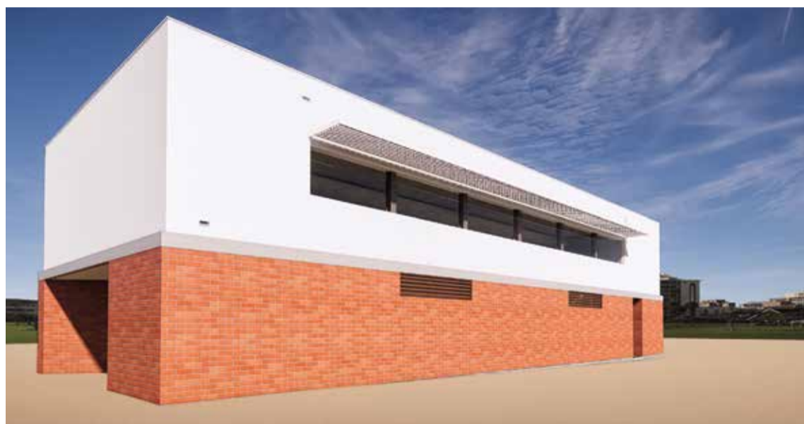
UM PAVILHÃO POLIVALENTE, COM MAIS DE 250 METROS QUADRADOS, VAI SER INSTALADO

clo, o projeto é acompanhado de diversas zonas de recreio para as crianças, projetadas para diferentes utilizações, em que se inclui áreas de estadia, de jogos e com equipamentos infantis, assim como um espaço dedicado a hortas pedagógicas. Acresce a criação de uma área desportiva dedicada ao pré-escolar e 1º ciclo, de acordo com o programa educativo em vigor, composta por um campo