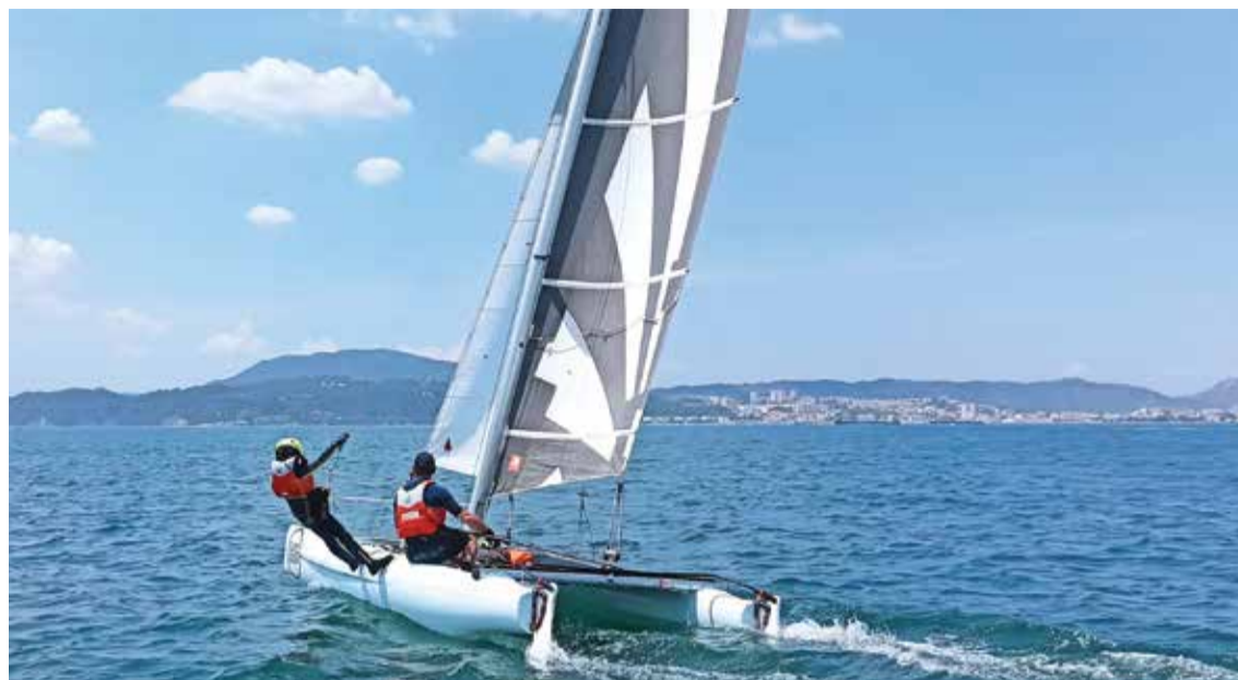
O Raid Bicasco/Sadocat é prova rainha dos catamarãs, com a Câmara de Setúbal envolvida na organização

A equipa sadina ganhou a competição só com vitórias