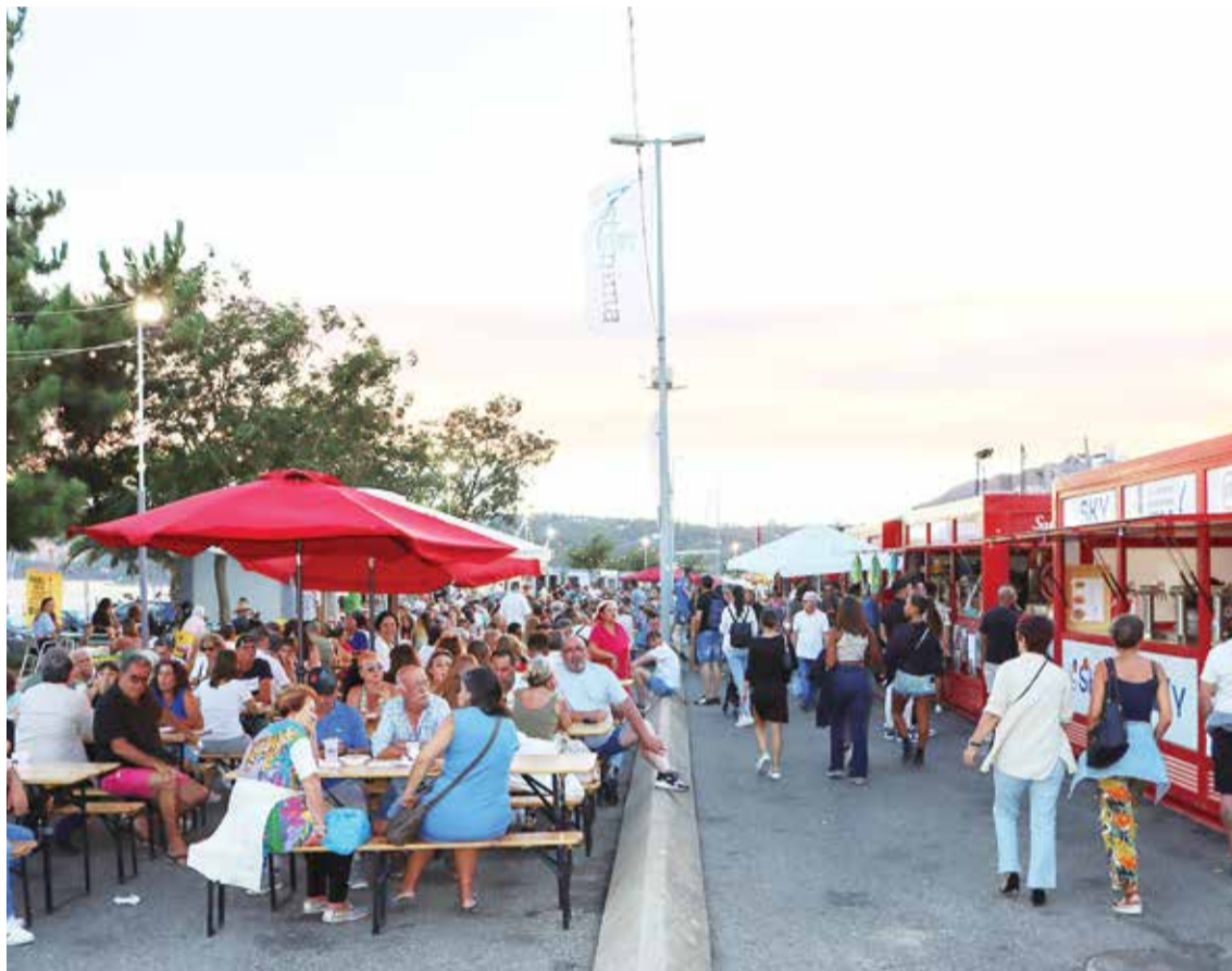
A gastronomia foi um dos pontos fortes desta festa do movimento associativo local

“As coletividades são uma chama viva da nossa sociedade e é extremamente importante a sua relação com o poder local,