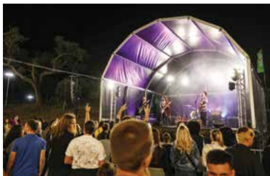
O Palco Encontros recebeu mais de quarenta espetáculos