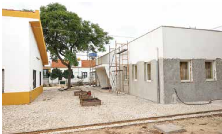
Os trabalhos decorrem no exterior e interior da escola

Os trabalhos envolvem, no caso do edifício destinado ao 1º ciclo, a substituição integral do pavimento interior, com a instalação de chão em vinil, o qual proporciona melhores condições de conforto, nomeadamente térmico. A intervenção contempla ainda a execução de trabalhos de reparação de fendas nas paredes interiores e exteriores