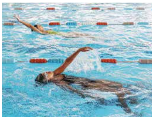
A natação é uma das atividades mais procuradas

▶ As crianças e os jovens dispuseram de danças urbanas