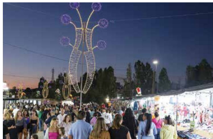
O certame é um ponto de encontro para famílias e amigos