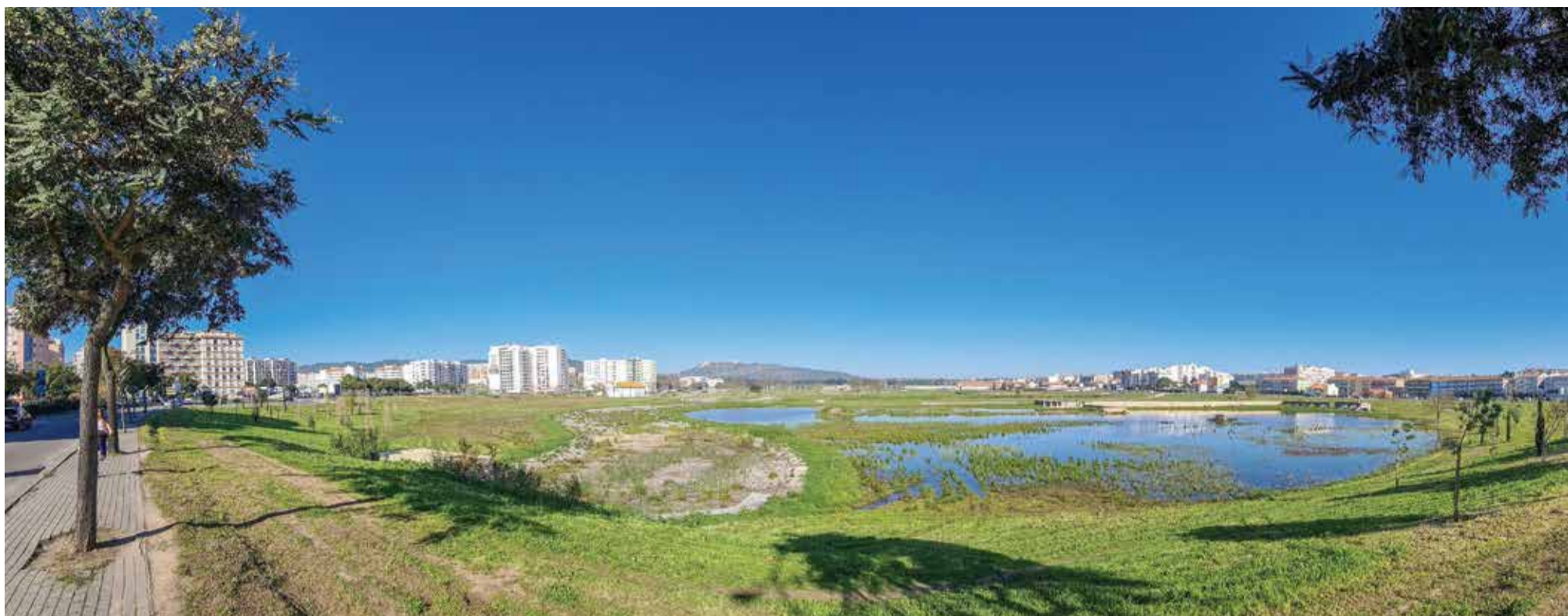
A bacia de retenção do Parque Urbano da Várzea permite evitar a ocorrência de inundações na cidade, num espaço que está a ser criado para grande área de lazer

POLÍTICAS AMBIENTAIS DO MUNICÍPIO RECONHECIDAS COM BANDEIRA VERDE