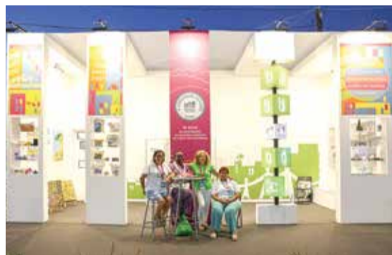
Alguns dos principais projetos municipais foram divulgados