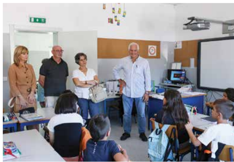
As crianças da EB do Montinho da Cotovia têm melhores condições de ensino

Na EB de Vila Fresca de Azeitão, foi instalado um toldo na área de recreio, houve pintura interior e exterior de todo o edifício e “o piso antigo, que tornava al-