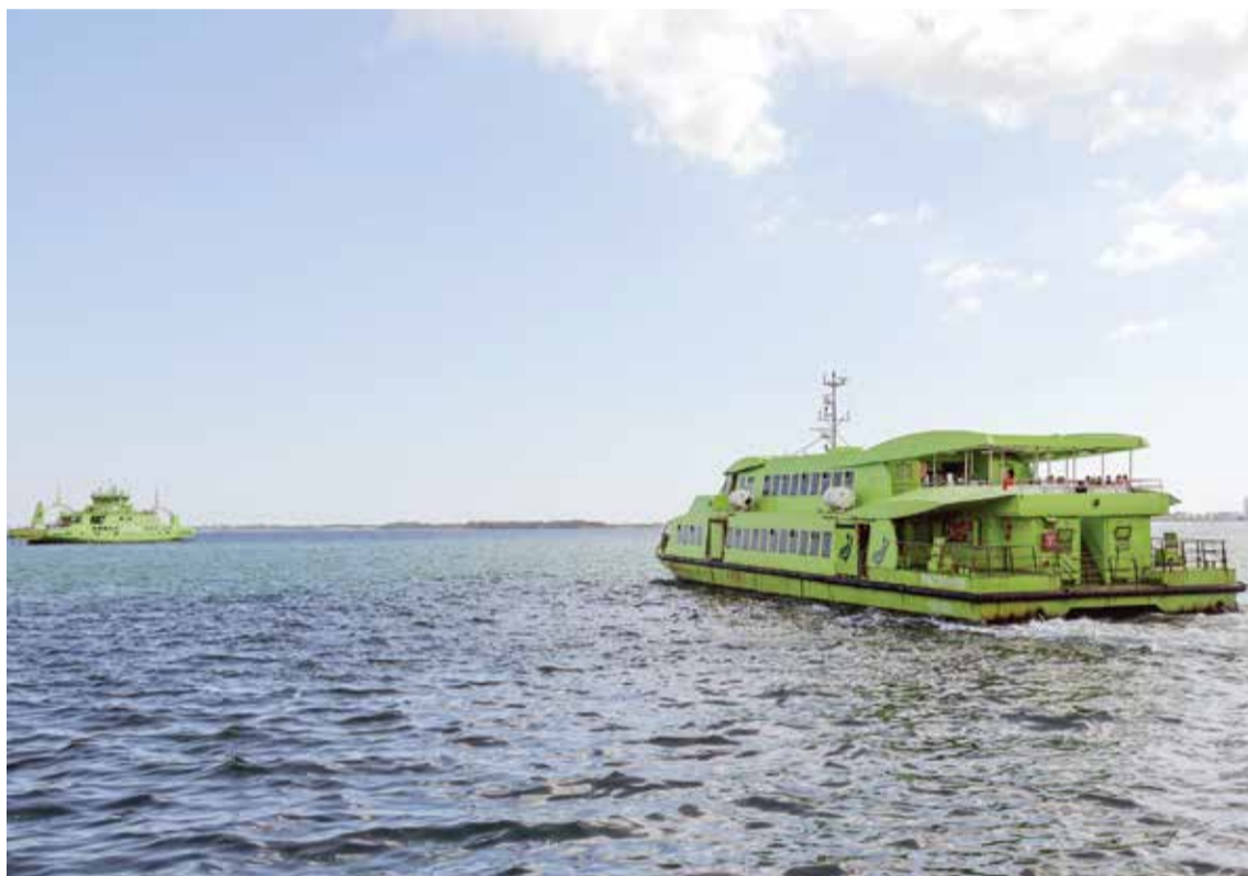
Os aumentos dos preços da travessia do Sado estão no centro da contestação dos municípios

O s presidentes das câmaras municipais de Setúbal, Alcácer do Sal e Grândola reuniram-se com o ministro das Infraestruturas e Transportes por duas vezes em outubro e mostram-se confiantes numa solução rápida que reduza significativamente os preços da travessia fluvial do Sado. Após os autarcas apresentarem os motivos que os unem na luta para "tornar mais acessível o acesso fluvial a Troia", no dia 17, o Governo manifestou abertura para ajudar os municípios e, em novo encontro, a 30, foi decidido criar um grupo de trabalho, com representantes nomeados pelo Governo, para dar uma