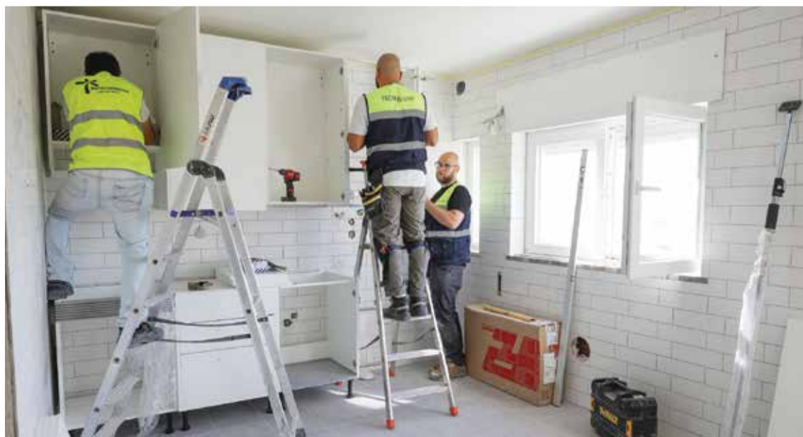
A construção e reabilitação em curso pretendem proporcionar habitação digna

“Quero manifestar o grande empenho e interesse do município de trabalhar no projeto-piloto, que nos permite construir em Setúbal 50 fogos cooperativos. Pode ser uma cooperativa, podem ser duas cooperativas, pode ser uma cooperativa de dez pessoas que