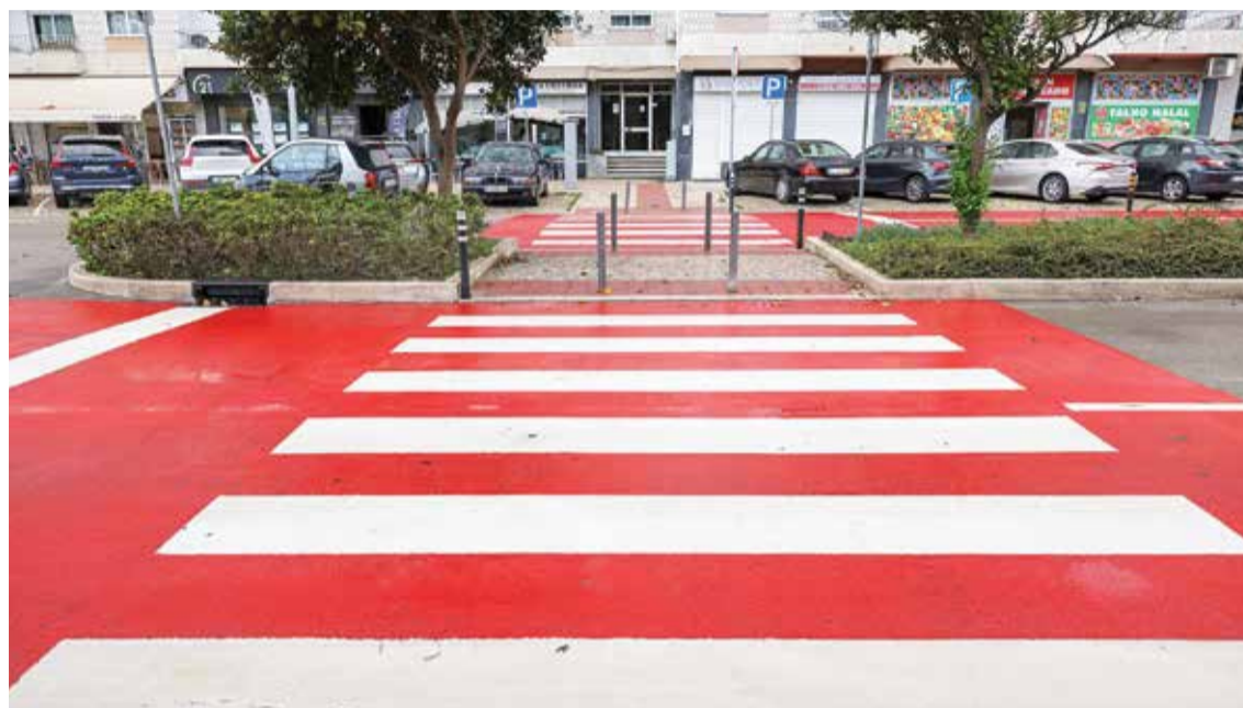
Lavagem de passadeiras, para aumentar a segurança dos peões, começou junto do Parque do Bonfim

Para aumentar a segurança dos peões, a Câmara Municipal está a lavar as passadeiras onde há mais movimento. Está ainda previsto o lançamento de uma empreitada para pintar mais 400 passadeiras