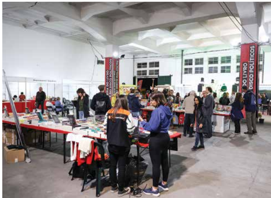
A literatura e a música associadas à intervenção política estiveram ao dispor do público

PRIMEIRA EDIÇÃO DA FEIRA DO LIVRO E DO DISCO POLÍTICOS