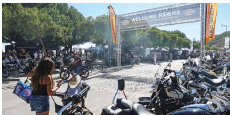
O Setúbal Custom Weekend voltou a atrair muitos interessados em motos

qual participam pessoas de todo o país e do estrangeiro. A oitava edição do Setúbal Custom Weekend, coorganizado pela Harley Riders Setúbal e pela autarquia, reuniu 120 expositores, nacionais e estrangeiros, de produtos e serviços dedicados à customização de motos, entre os quais o da Harley-Davidson/American Motorcycles, o principal patrocinador, que apresen-