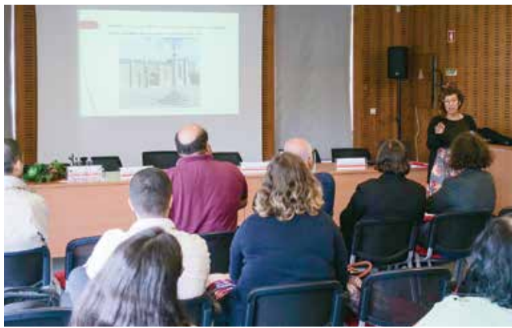
As Jornadas Bienais de Estudos Locais debateram diversas áreas da cidade