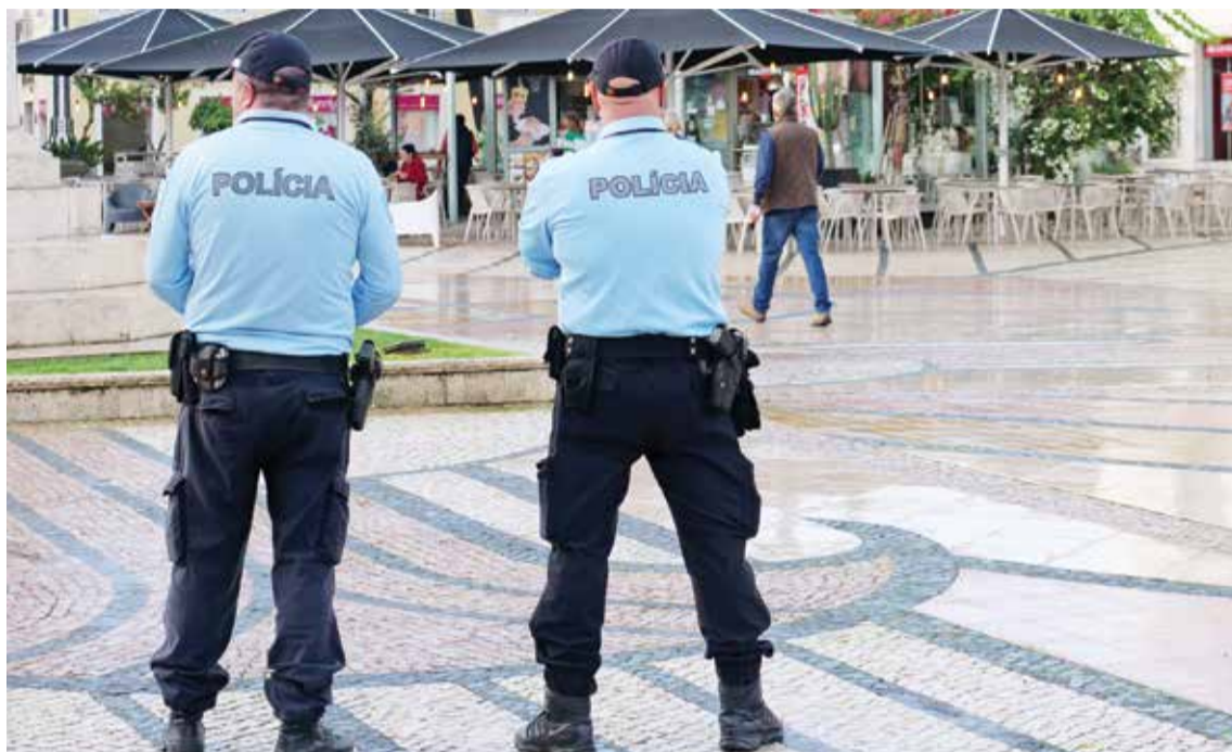
A autarquia reafirma que o dispositivo policial tem escassez de meios e volta a alertar o Governo

A necessidade de reforçar os recursos humanos da PSP foi reiterada pelo presidente em carta aberta enviada ao ministro da Administração Interna. A Câmara também aguarda resposta à disponibilidade que manifestou com a cedência de espaços para a construção de novas instalações da força de segurança