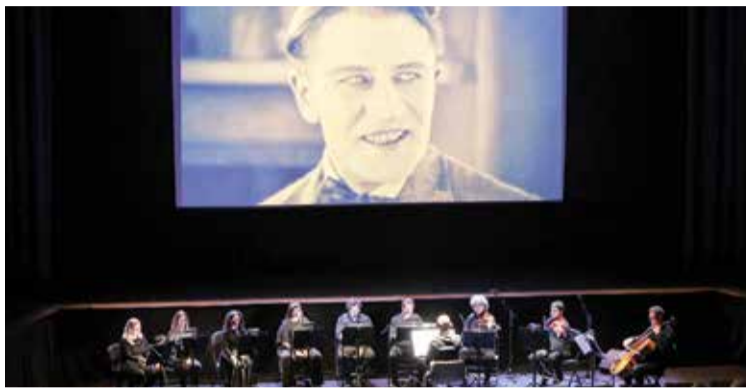
O thriller “O Inquilino Sinistro”, de Alfred Hitchcock, passou no Film Fest