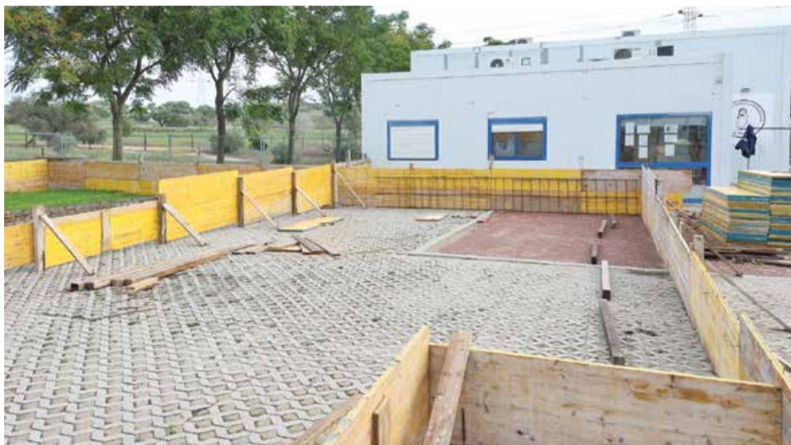
A construção da laje de betão marca a primeira fase da obra que dará mais condições à academia

Depois de um conjunto de beneficiações nas instalações da Academia de Dança Contemporânea de Setúbal, a Câmara Municipal está a ampliar o edifício. Tudo numa obra de 150 mil euros