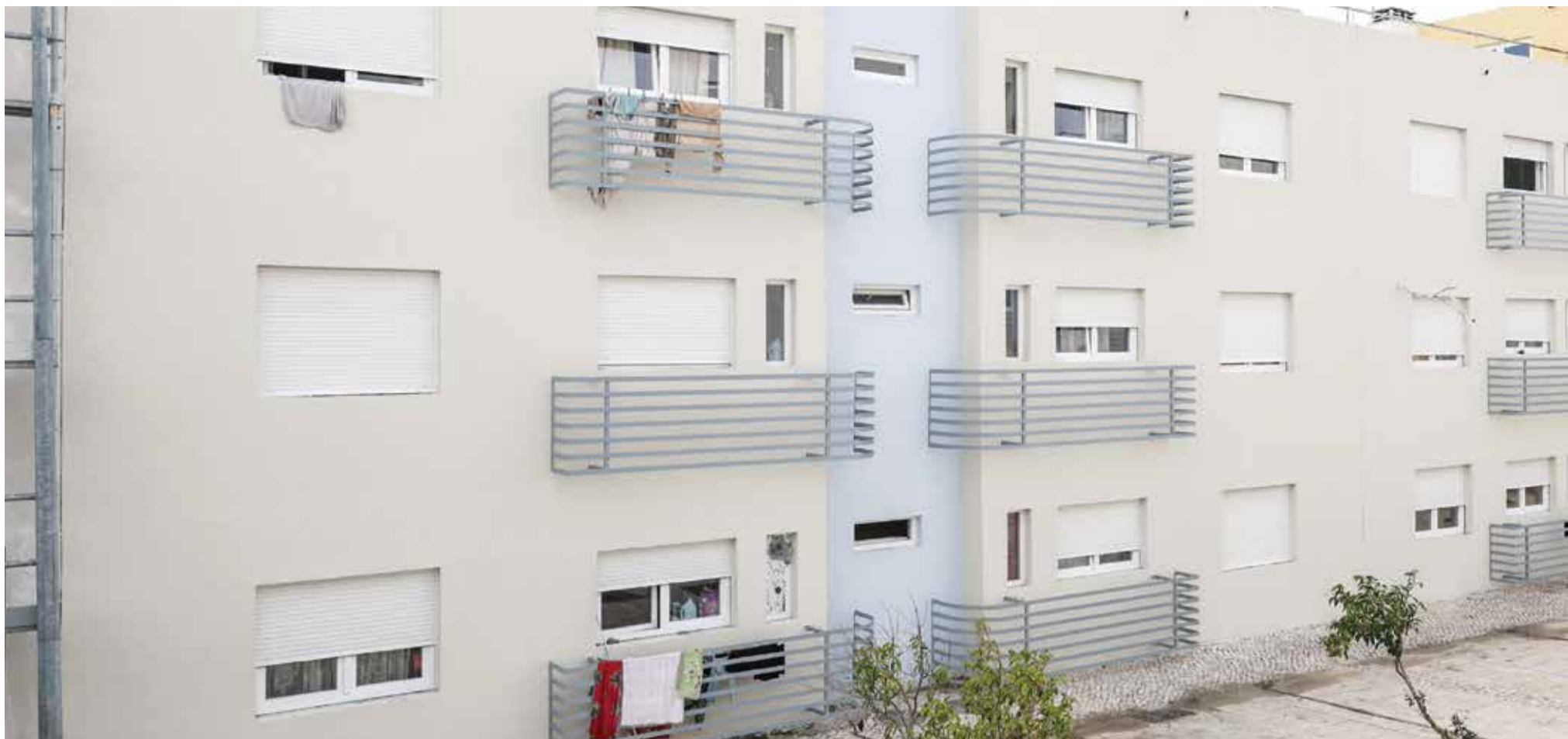
O esforço que o município está a fazer para resolver o problema da habitação pode vir a envolver cooperativas

ESTRATÉGIA LOCAL PODE RECEBER REFORÇO DO MOVIMENTO COOPERATIVO