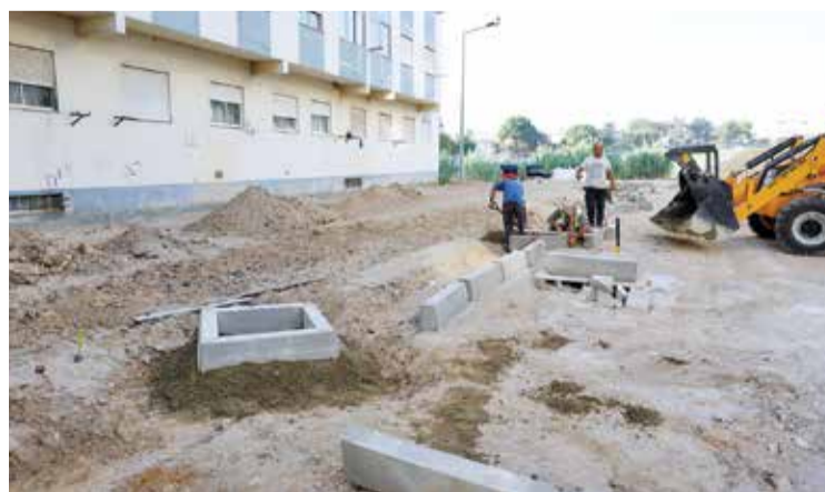
Um espaço no Monte Belo é requalificado com novas soluções urbanas

execução de 60 dias e um custo superior a 120 mil euros, inclui a criação de uma bolsa de estacionamento com vinte lugares e novas acessibilidades. A beneficiação desta área com 1360 metros quadrados localizada entre a Estrada do Alente-