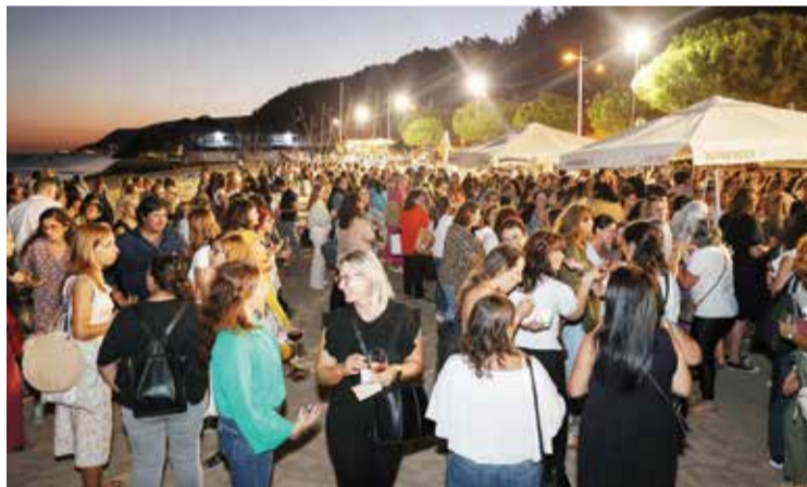
A cerimónia juntou sete centenas de agentes educativos

Cotovia e recordou que, em breve, avança a construção do Centro Escolar Barbosa do Bocage, que, com ampliação da EB do Bocage, adiciona pré-escolar e 1º ciclo ao equipamento atual.