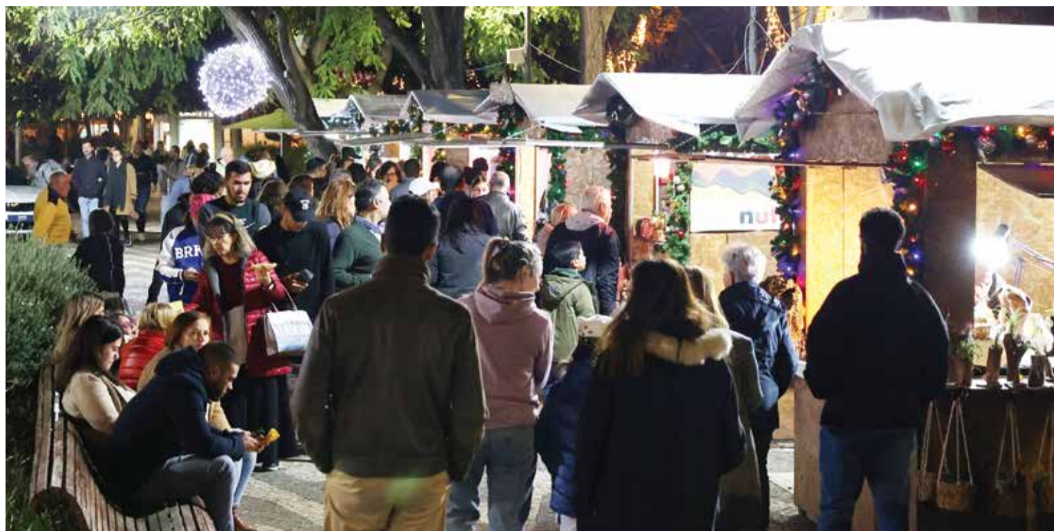
O mercado é um dos atrativos do Natal em Setúbal, com diversos stands de produtos regionais muito variados

PROGRAMA CONTEMPLA ATIVIDADES PARA AS FAMÍLIAS ATÉ 7 DE JANEIRO