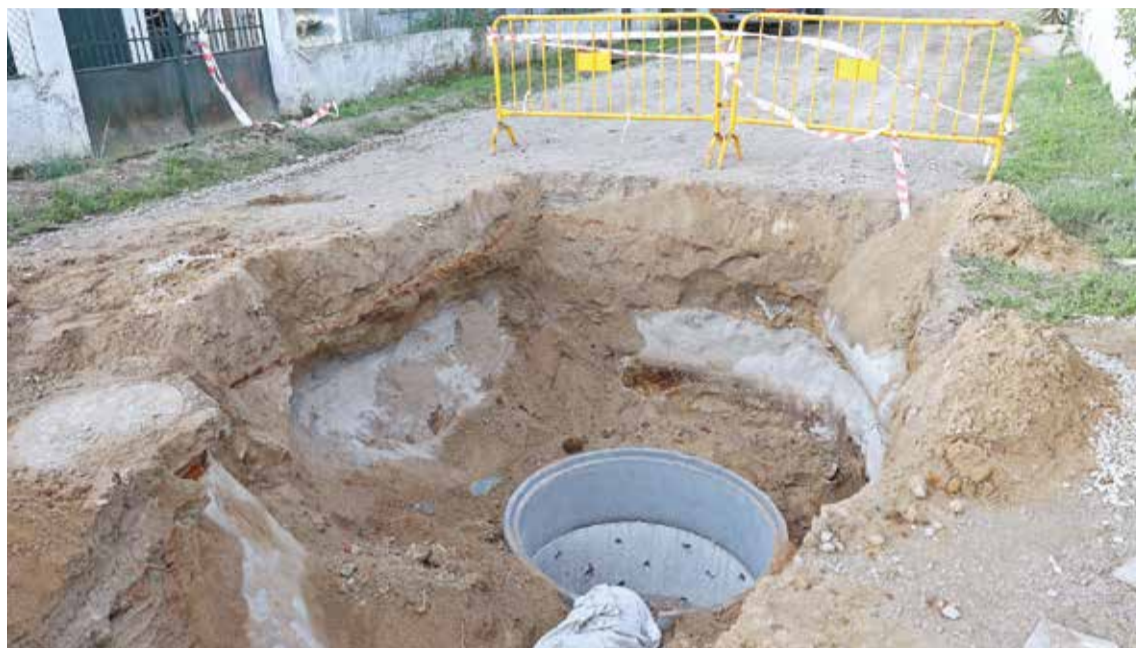
A Rua da Tradição recebe sistema de recolha de águas da chuva e requalificação do pavimento e dos passeios

U m projeto da Câmara Municipal de Setúbal com obras a cargo da Junta de Freguesia de Azeitão está a proceder a uma intervenção que vai requalificar a Rua da Tradição e criar condições para impedir as inundações que se verificavam. O investimento, superior a 80 mil euros, inclui a instalação de um sistema de drenagem pluvial, para recolha das águas da chuva, que não existia no local, e a requalificação do arruamento, incluindo passeios. Iniciada em outubro, com um prazo previsto de execução de 90 dias, a empreitada, acompa-