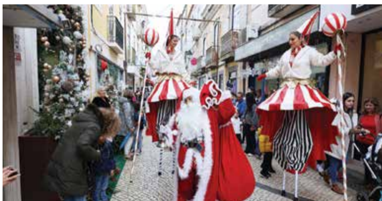
O Pai Natal chega a 25 de novembro para animar os festejos

As luzes de Natal acendem-se no dia 24 de novembro e iluminam o caminho para o Pai Natal que aterra em Setúbal no dia seguinte. É o início da celebração da quadra festiva, que promete muita animação na cidade até 7 de janeiro