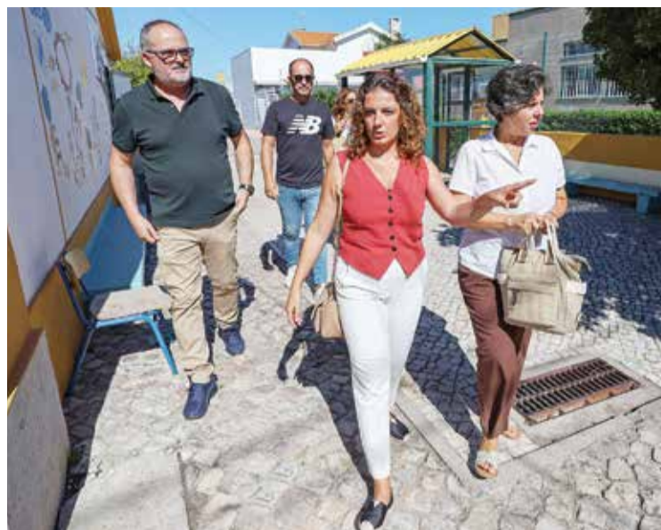
A EB de Vila Fresca de Azeitão recebeu um vasto conjunto de beneficiações

guns espaços no interior do edifício um pouco frios e desconfortáveis, foi substituído por pavimento vinílico”, sublinhou a autarca.