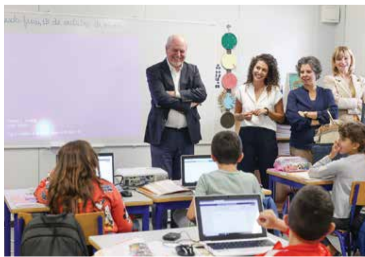
A EB do Faralhão, no Sado, recebeu mobiliário e material didático