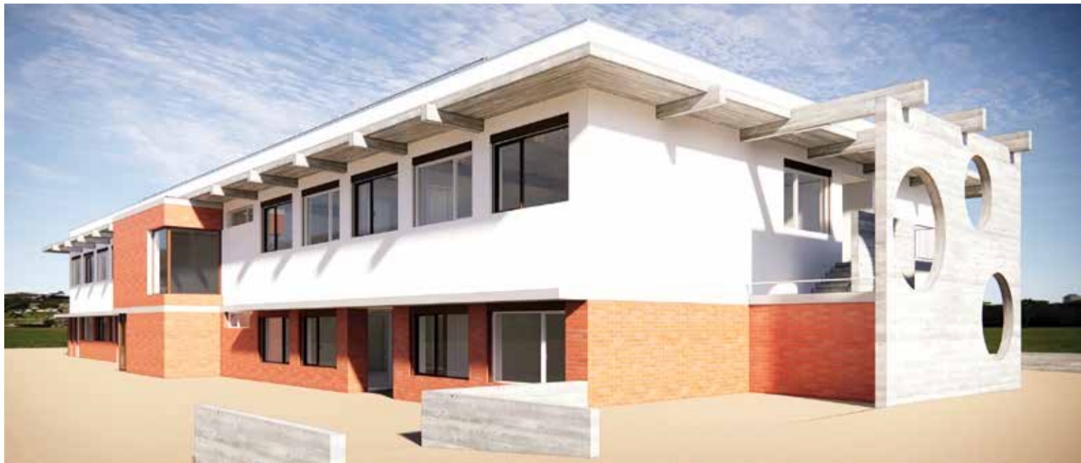
O futuro Centro Escolar Barbosa du Bocage adiciona as componentes de 1.º ciclo e pré-escolar aos atuais 2.º e 3.º ciclos

CENTRO ESCOLAR BARBOSA DU BOCAGE COM 1.º CICLO E JARDIM DE INFÂNCIA