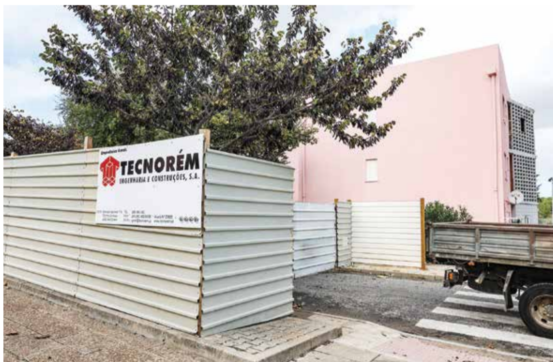
O estaleiro já está montado na Alameda das Palmeiras

Algumas vão ser construídas em frente da Urbanização Encosta do Parque, na zona do Parque Verde da Bela Vista, enquanto na Quinta da Parvoíce, onde foi demolido um bairro de barracas, vão ser edificados 137 fogos de habitação pública, 43 de renda apoiada pela Câmara Municipal, num investimento de cer-