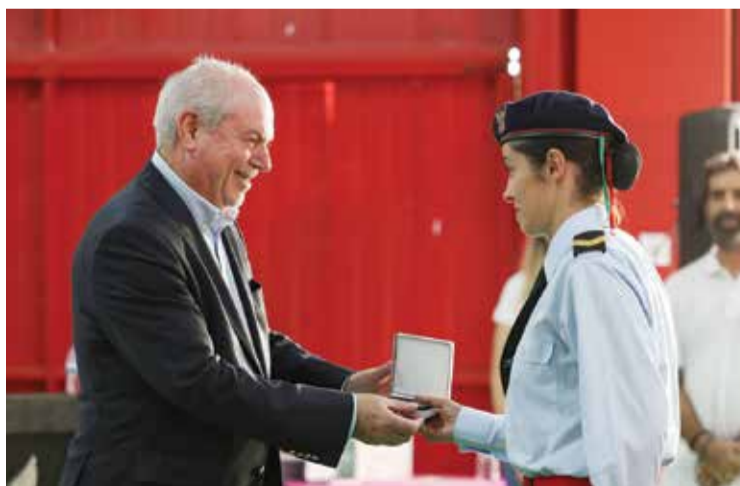
A corporação de bombeiros celebrou 140 anos

O autarca sublinhou que o investimento municipal nos Voluntários, que tem vindo a ser reforçado, é de cerca de 450 mil euros anuais e abrange, entre outros, o funcionamento da Centro Municipal de Operações de Socorro e a atividade operacional na freguesia de Azeitão. Os Bombeiros Voluntários de