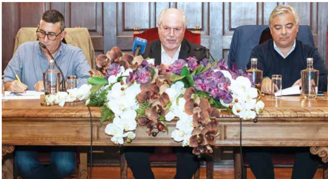
Os autarcas de Setúbal, Palmela e Sesimbra estão muito preocupados com o agravamento dos problemas na saúde

FÓRUM INTERMUNICIPAL DE SAÚDE CONVOCA NOVA AÇÃO DE PROTESTO