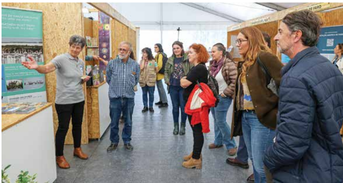
A feira contou com mais de três dezenas de expositores, além de atividades de natureza

A 12ª edição da feira de turismo de natureza Observanatura chegou este ano a mais locais e teve mais dias, ultrapassando as fronteiras da Herdade da Mourisca, onde começou, a 28 e 29 de outubro, com o habitual certame. O evento, organizado pelo Instituto da Conservação da Natureza e das Florestas, em colaboração com os municípios de Setúbal, Sines e Santiago do Cacém e com a TroiaNatura, voltou a promover o património natural protegido como espaço propício ao desenvolvimento de atividades específicas. De regresso após três anos de