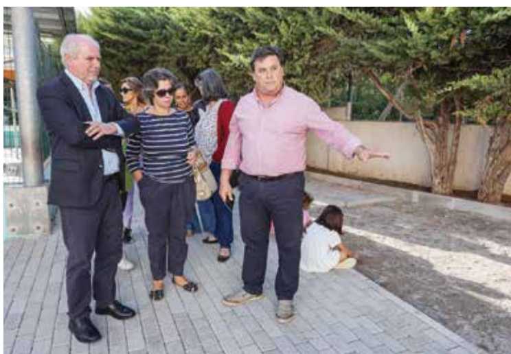
A EB nº 9 do Casal das Figueiras, na UF de Setúbal, recebeu pavimento novo

“Houve intervenções para que as escolas que são responsáveis do município possam oferecer as melhores condições de aprendizagem para as crianças e de trabalho para professores e pessoal não docente”, afirmou