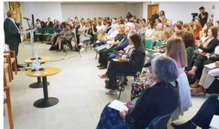
O congresso debateu questões relacionadas com os enfermeiros

■A sustentabilidade da gestão da saúde e da enfermagem esteve em foco no 13.º Congresso Internacional APEGEL – Associação Portuguesa dos Enfermeiros Gestores e Liderança, realizado a 19, 20 e 21 de outubro. Workshops e conferências fizeram parte do programa de três dias do encontro, com ações centradas no Esperança Centro Hotel, em que 250 participantes debateram temas da sustentabilidade da gestão em enfermagem, da liderança, da formação e da empregabilidade da enfermagem.