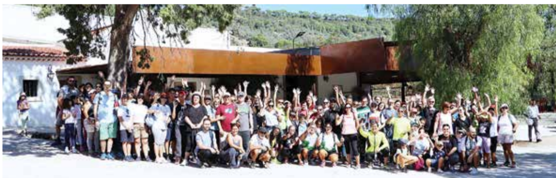
O passeio, das Caminhadas de São Sebastião, juntou 120 participantes de várias gerações

Campanha pela recolha dos dejetos caninos