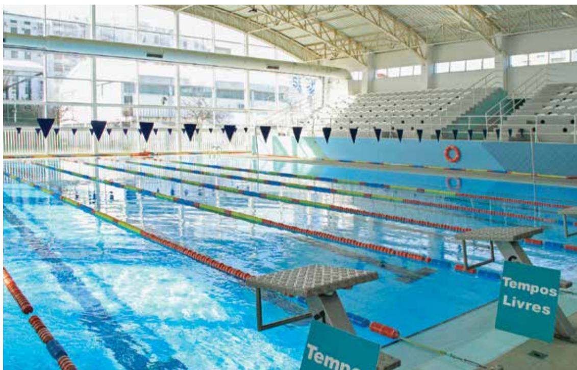
A Piscina das Palmeiras, de 1999, esteve 25 anos sob gestão do Clube Naval Setubalense

A oferta desportiva municipal é alargada a partir do início de dezembro com a passagem da gestão da Piscina das Palmeiras para a esfera camarária. A transição implica alterações no modelo de funcionamento, mas sem que os utilizadores do equipamento saiam prejudicados