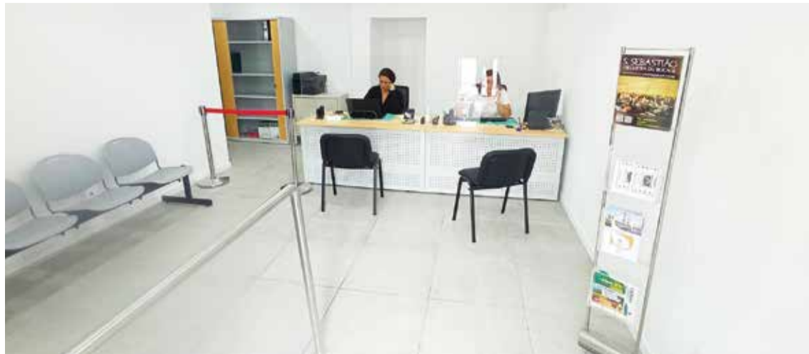
A nova delegação da Junta de S. Sebastião localiza-se em São Domingos