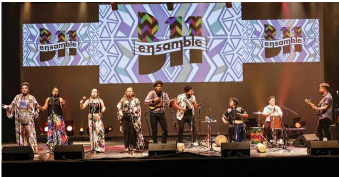
Os Ensemble B11, da Venezuela, deram um espetáculo no Fórum Municipal Luísa Todi

Setúbal foi a capital da música ibero-americana pelo quinto ano consecutivo. Concertos em vários locais e um congresso sobre cultura nas cidades mostraram a diversidade deste vasto território mundial