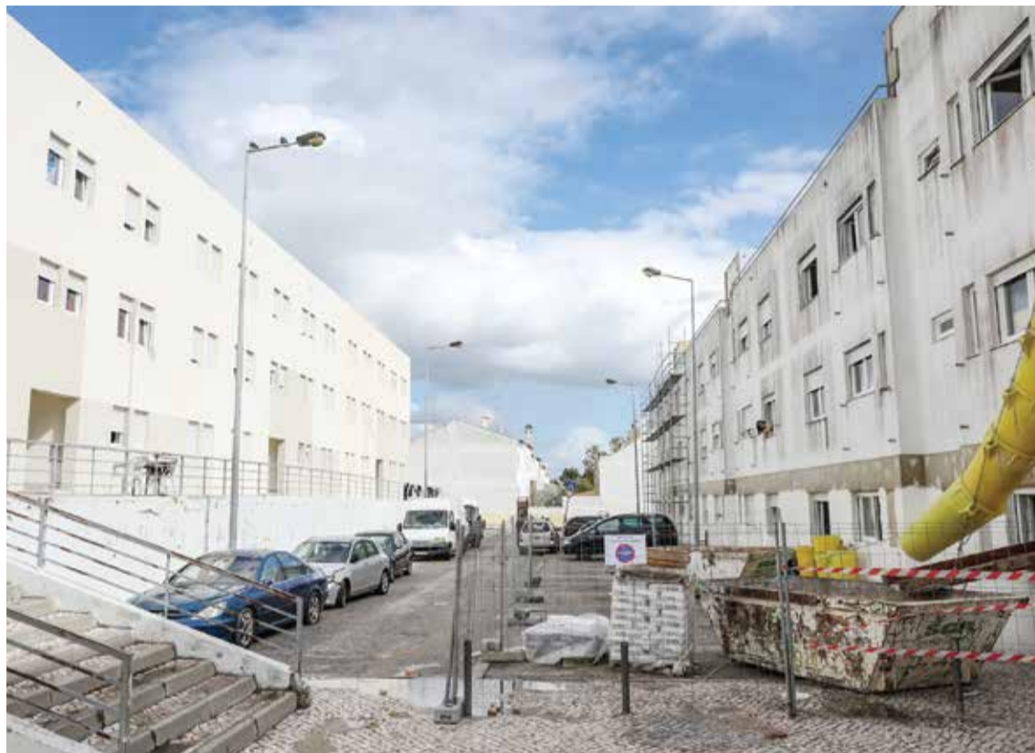
A intervenção das Manteigadas foi a primeira a avançar