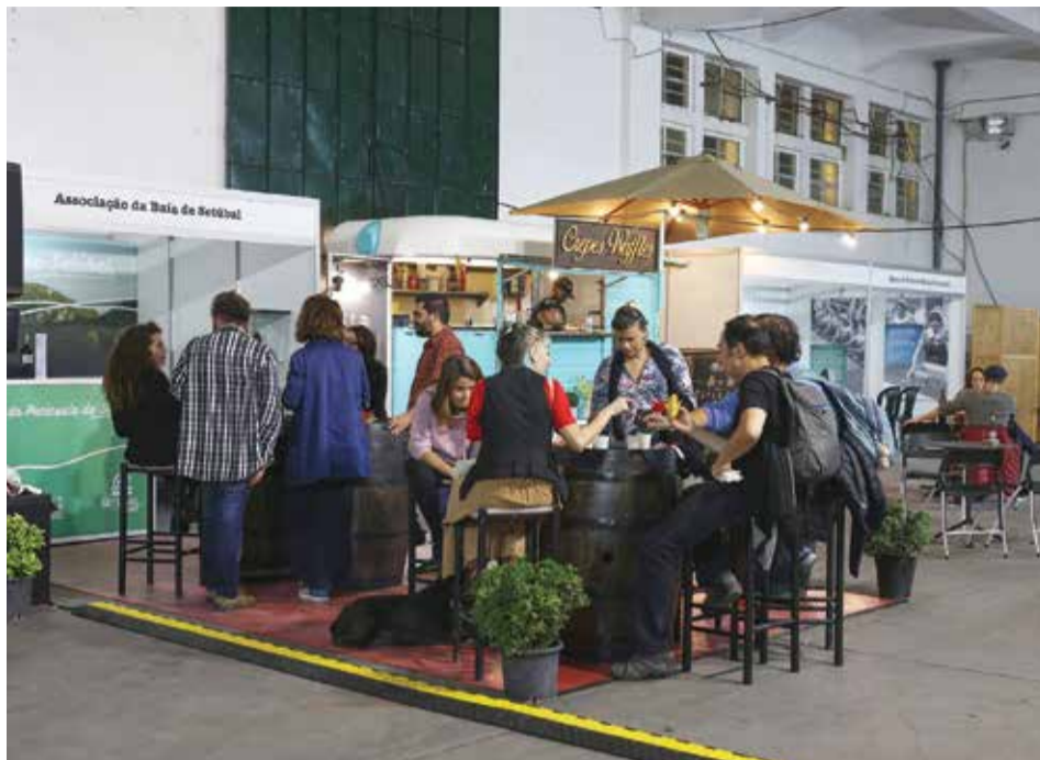
O evento contou com um espaço gastronómico com petiscos internacionais e vinhos