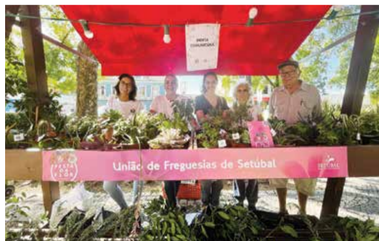
A freguesia participou na Festa da Flor com projeto próprio

Foi igualmente dinamizada uma oficina de bombas de sementes, para sensibilizar crianças para os desafios climáticos e ensinar quais as plantas autóctones, preparadas para resistir ao clima atual sem necessitar de irrigação.