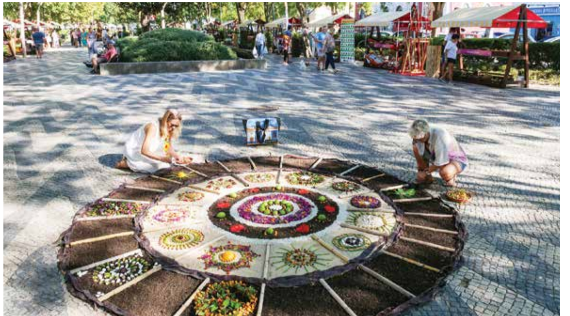
A construção de uma mandala coletiva foi um dos pontos altos pelo envolvimento das pessoas e o impacto visual

Realçando o facto de a Festa da Flor ter tido uma pausa de dois anos, devido à pandemia, a autarca afirmou que o certame “voltou em força” , com “inova-