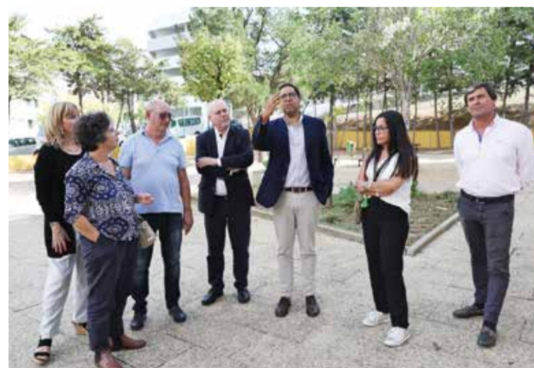
A EB do Bairro Afonso Costa foi uma das escolas melhoradas em S. Sebastião