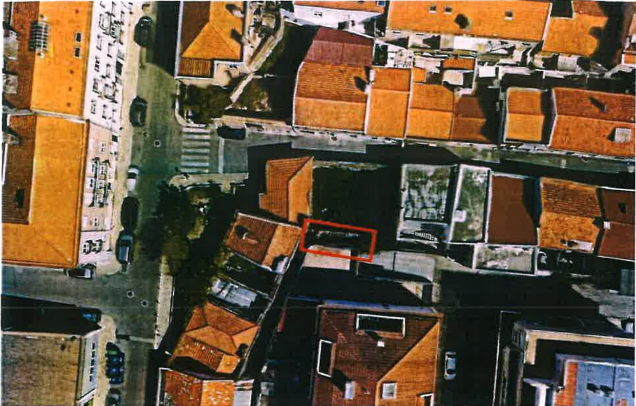
Planta de localização - Imagem aérea Google Earth

A parcela de terreno em análise localiza-se nas traseiras do n.º 49 a 55 da Rua das Alcaçarias, Bairro Salgado, na União das Freguesias de Setúbal, em Setúbal.