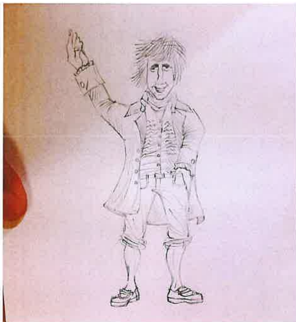
desenho oferecido por um aluno da Escola Secundária D. João II, desenhado ao vivo no decorrer do espetáculo (2016)